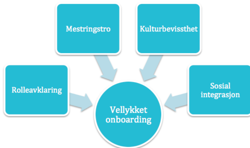
Figur 1, Vår konstruksjon av Bauer (2010) sine fire nivåer for en vellykket onboardingprosess.

Bauer (2010, 6) presenterer fire hovednivåer for en vellykket onboardingprosess; mestringstro, rolleavklaring, sosial integrasjon og kulturbevissthet. For å oppnå en vellykket onboardingprosess mener Bauer at alle de fire nivåene må være oppfylt. Det kan imidlertid være vanskeligheter med å skille mellom nivåene, da de til en viss grad vil flyte over i hverandre i praksis.