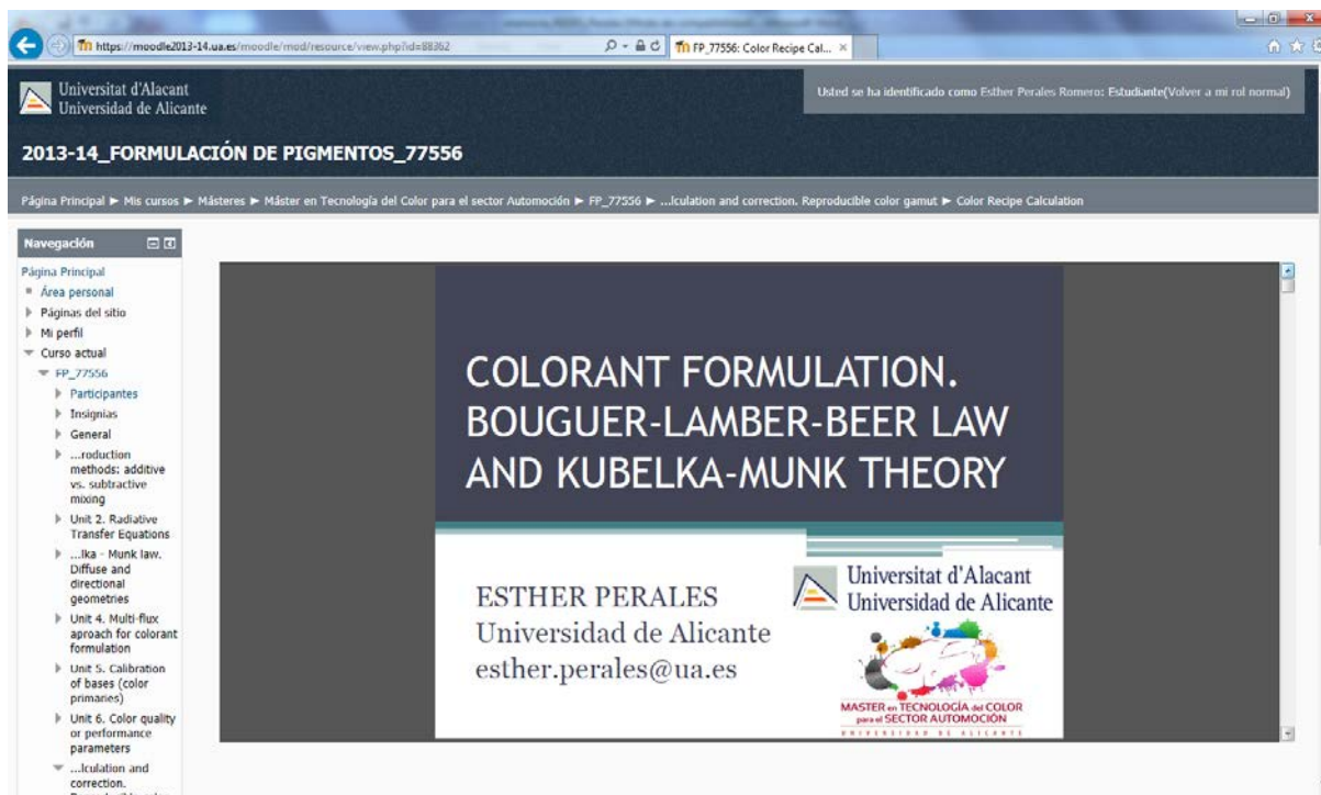
Figura 6. Ejemplo del contenido teórico de una unidad de la asignatura “Reproducción del Color” en la plataforma Moodle.