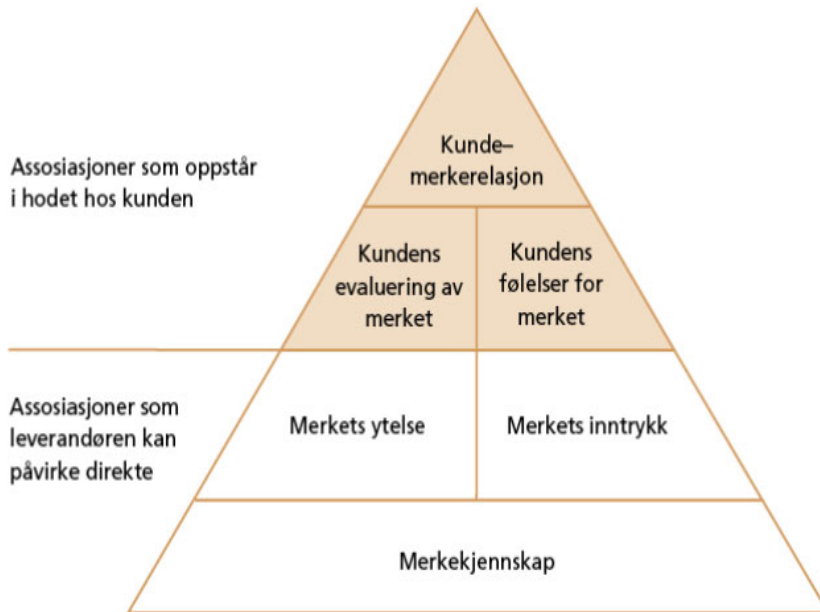
Modell 3: Merkevarepyramiden (Samuelsen, Peretz og Olsen 2010, 93)

“Er det slik at tilhørighet og mediapåvirkning styrer holdninger til merkevarer av sportsbekledning?”