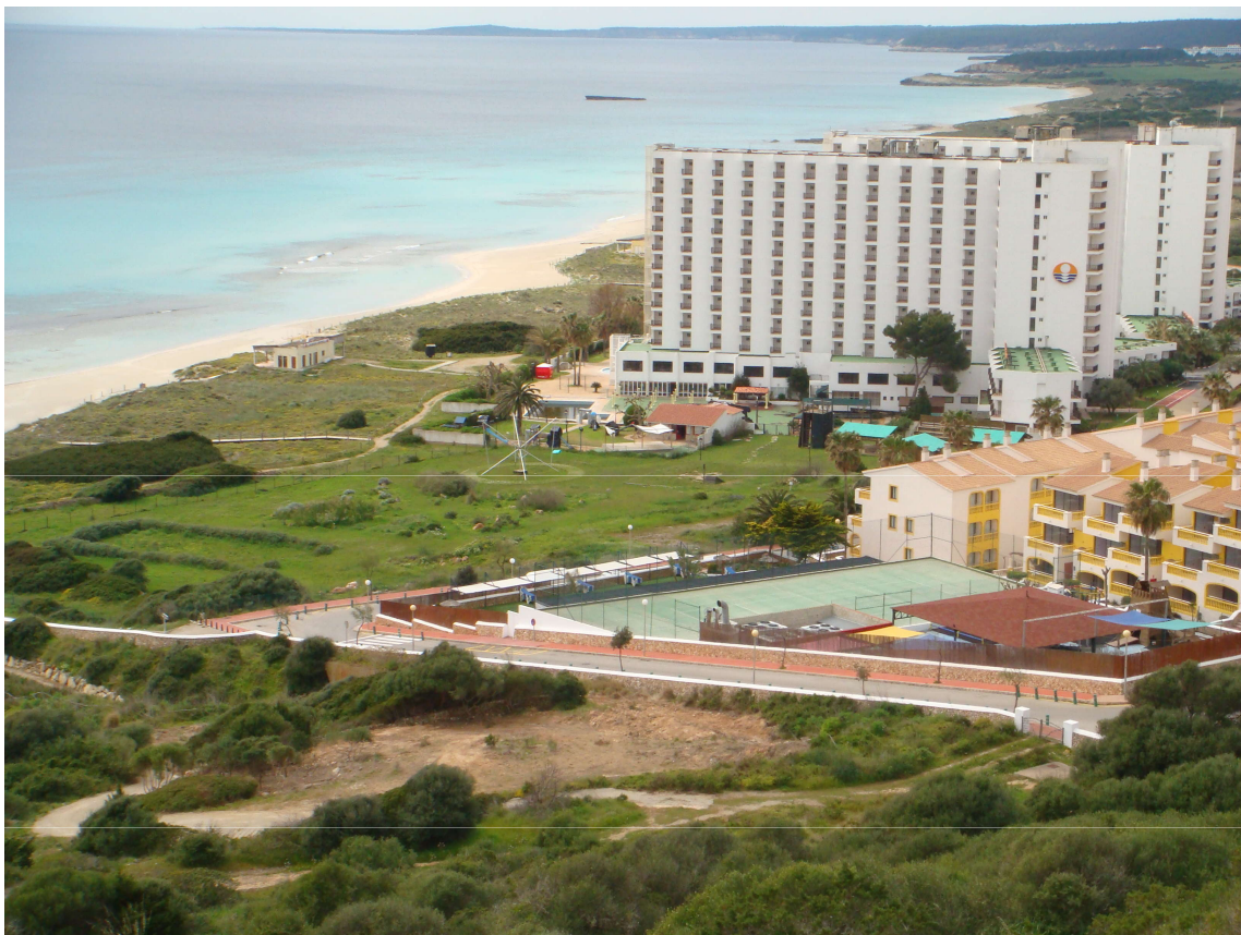
Figura 4. Ámbito del traslado de aprovechamiento urbanístico del Área de Reconversión Territorial de Son Bou (Menorca) junto al hotel Sol Milanos Pingüinos.