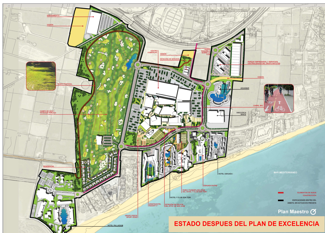
Figura 3. Propuesta de planificación territorial turística presentada por el Grupo Empresas Matutes mediante el “Plan de Excelencia Eivissa, Platja d’en Bossa”, que publicitan como “EiviVegas”.