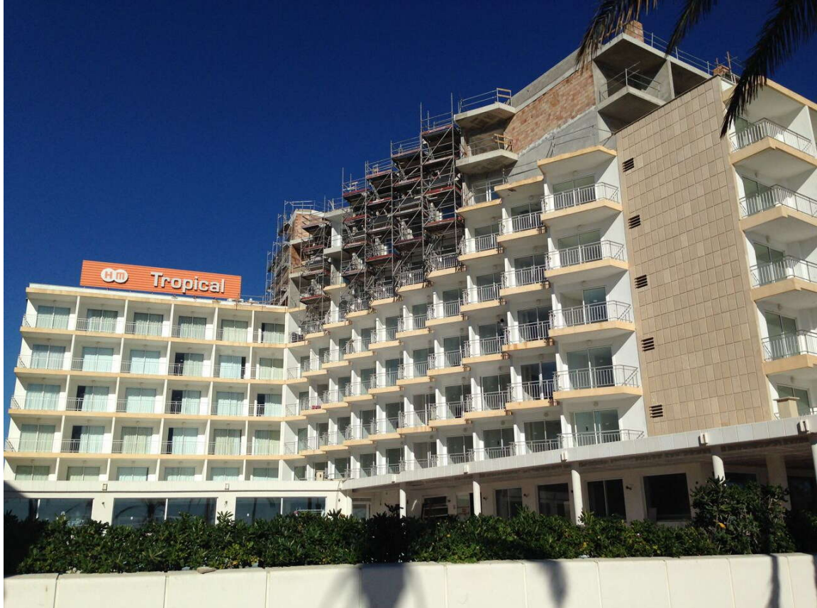
Figura 1. Ejemplo de adición de dos plantas en hoteles y edificios de apartamentos en las zonas turísticas maduras de las Islas Baleares. Hotel HM Tropical, situado en la primera línea de la Platja de Palma.