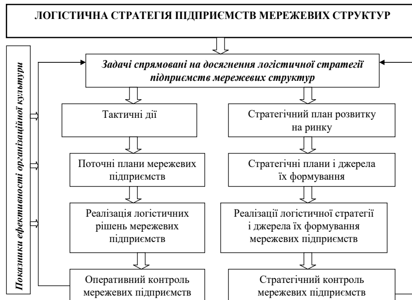
Рисунок. 1. Принципова схема обґрунтування логістичної стратегії підприємств мережових структур у контексті культурної компоненти