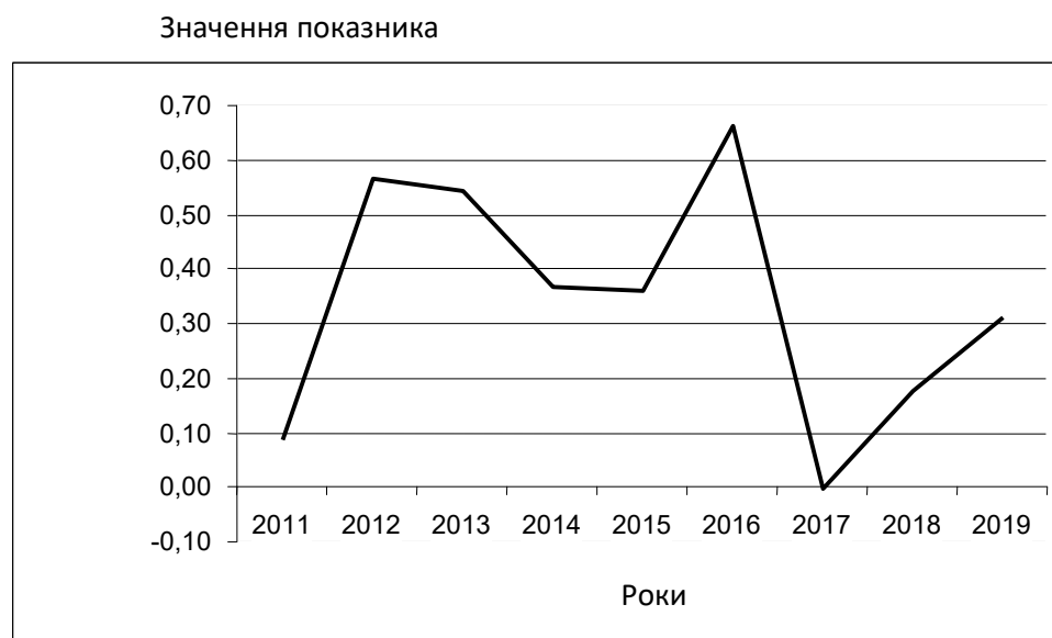
Рисунок 3. Динаміка формування показників логістичних стратегій підприємств мережових структур країни