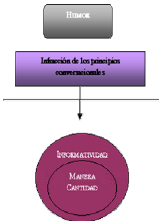
Figura 1: Infracción de los principios conversacionales en el humor

Como veremos, el principio de Informatividad, principio de refuerzo para Levinson (2000), se infringe de forma frecuente en el humor; las huellas de esta infracción son los indicadores que tienen que ver con las relaciones semánticas, como la polisemia, la ambigüedad, la homonimia, la paronimia, etc. El resto de principios quedan supeditados a la infracción de este principio, el de Informatividad, como se representa en la Figura 1: