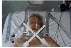
Figura 4. Helment.

• Helment (Casco en Inglés): es utilizado para reducir las complicaciones directamente relacionadas con los otros tipos de interfases nombrados anteriormente.