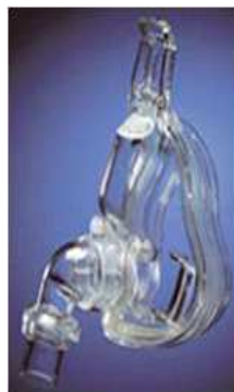
Figura 2. Mascarilla oronasal

• Mascarilla oronasal: se utiliza principalmente en patologías respiratorias agudas (hipoxia, hipercapnia, etc.)