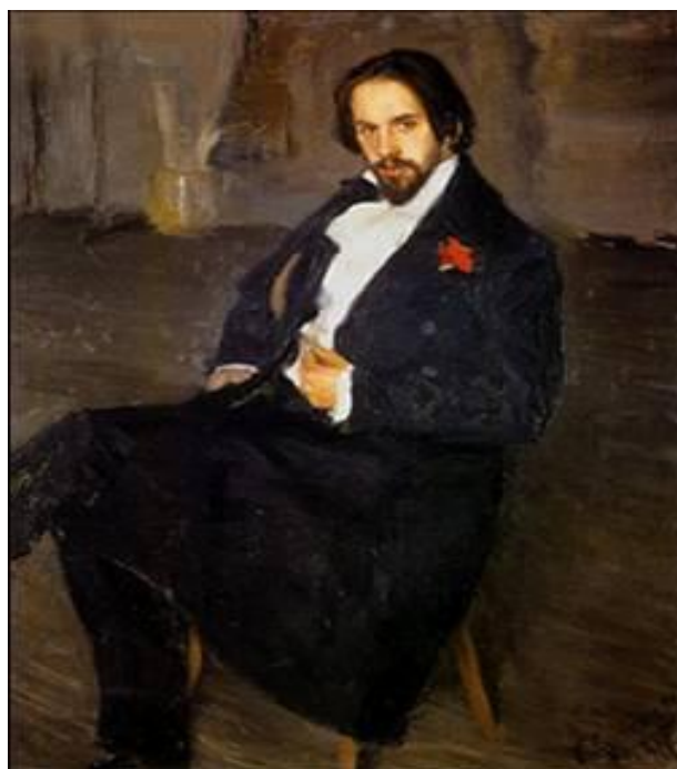
Рис. 2. Портрет И.Я. Билибина

(Женские образы в живописи и графике русского модерна. – URL: http://www.liveinternet.ru/users/la_belle_eroque/post68099844/ (дата обращения: 12.10.2015)