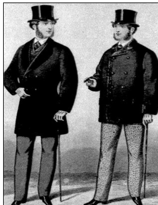
Рис. 2. Мужской костюм в стиле капитализм. 1865 г. Сюртук приближается к форме классического пиджака

(Кибалова Л., Гербенова О., Ламарова М. Указ. соч. – С. 571)