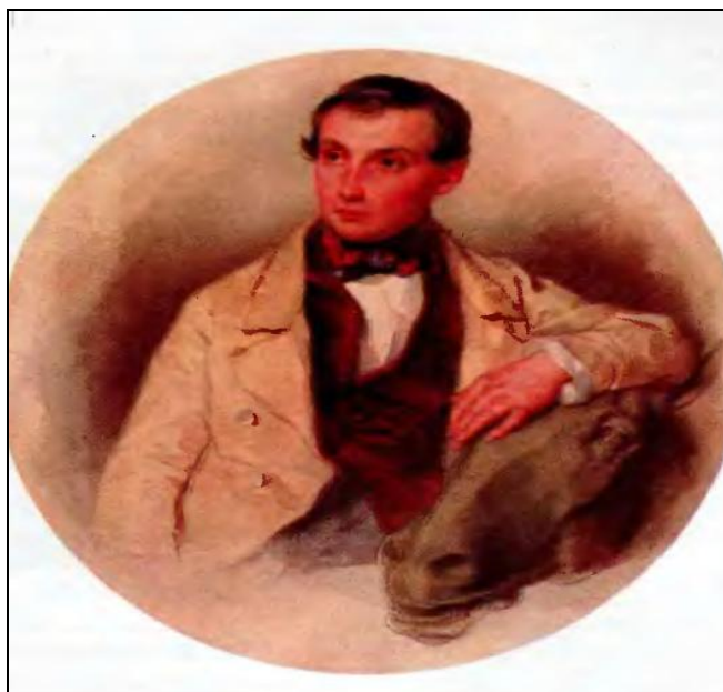
Рис. 1. Портрет скульптора П.К. Клодта

(Соколов П.Ф. Портрет скульптора П.К. Клодта. 1805 г. – URL: