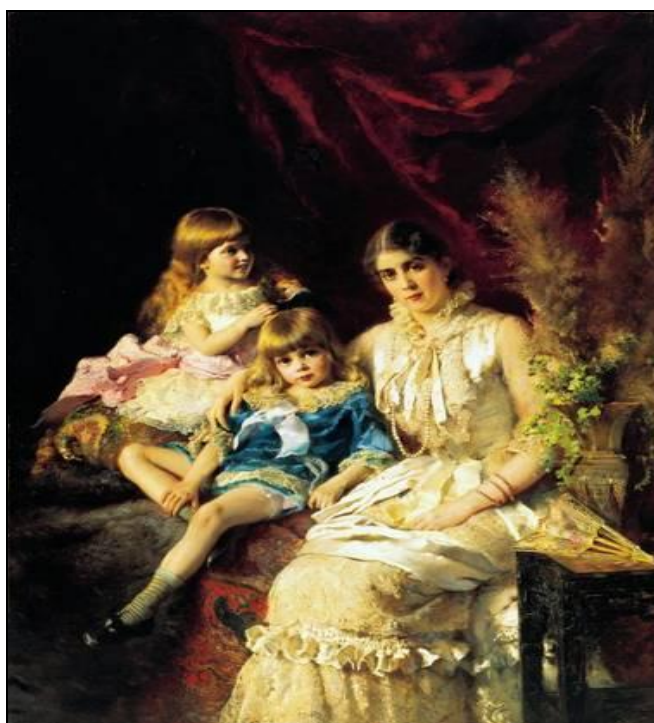
Рис. 2. Семейный портрет. Художник К.Е. Маковский. 1882 г.

(Репин И.Е. Автопортрет. 1878 г. – URL: http://sv-scena.ru/athenaeum/istoriya-russkoj-zhivopisi-v-xix-veke.imgdcde.jpg (дата обращения: 26.03.2015)