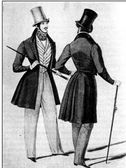
Рис. 1. Мужской дообеденный костюм в стиле романтизм. Фрак, светлые брюки, полосатый жилет, цилиндр и трость

(Кибалова Л., Гербенова О., Ламарова М. Указ. соч. – С. 571)