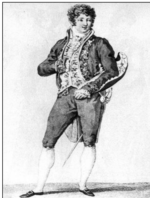
Рис. 2. Мужской светский костюм. Большая шляпа украшена перьями. С боку кавалер носил декоративную шляпу

(Кибалова Л., Гербенова О., Ламарова М. Иллюстрированная энциклопедия моды. – Прага, 1987. – С. 570)