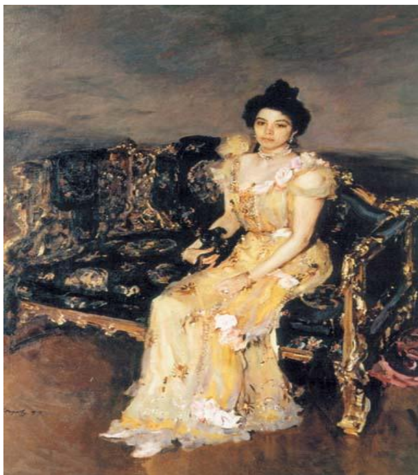
Рис. 1. Портрет С.М. Боткиной. Художник В. Серов. 1899 г.

(Женские образы в живописи и графике русского модерна. – URL: http://www.liveinternet.ru/users/la_belle_eroque/post68099844/ (дата обращения: 12.10.2015)