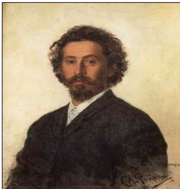
Рис. 1. Автопортрет И.Е. Репина

(Репин И.Е. Автопортрет. 1878 г. – URL: http://sv-scena.ru/athenaeum/istoriya-russkoj-zhivopisi-v-xix-veke.imgdcde.jpg (дата обращения: 26.03.2015)