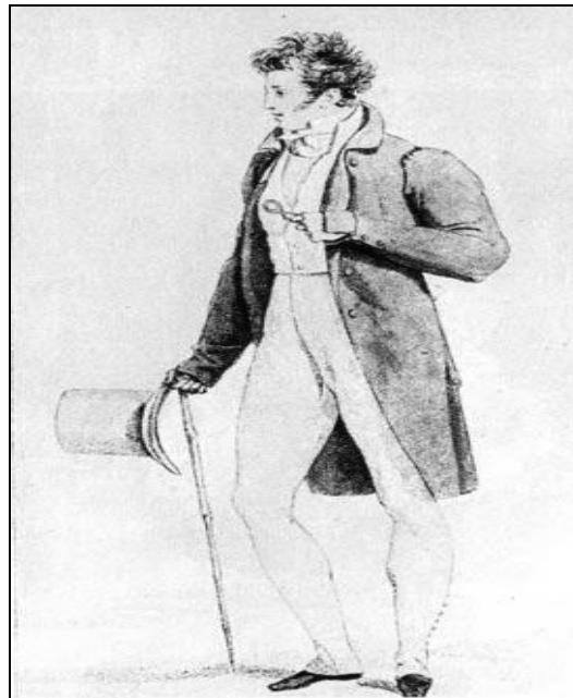
Рис. 1. Мужской сюртук и узкие штаны, к низу переходящие в гамашы. Костюм дополняет цилиндр

(Кибалова Л., Гербенова О., Ламарова М. Иллюстрированная энциклопедия моды. – Прага, 1987. – С. 570)