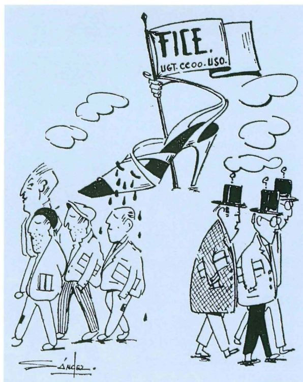
Vinyeta publicada a La Verdad el 30 novembre 1979.

La posició de Comissions Obreres era relativament diferent a la d'UGT, tenint em compte que el seu « Pla de lluita contra l'atur » es va presentar al febrer, prèviament a les eleccions generals i municipals de 1979. De manera que el discurs de la central sindical proposava als treballadors que votaren als partits obrers que defenien la línia sindicalista de CCOO. En el tema de l'atur laboral, proposava la creació d'una comissió de treball permanent integrada per representants dels sindicats que s'encarregaren de controlar l'aplicació, entre d'altres, de les hores extraordinàries per part dels empresaris, l'entrada de nous operaris a les fàbriques, el control dels cursets que s'impartien als treballadors i la negociació dels contractes eventuais amb la patronal.