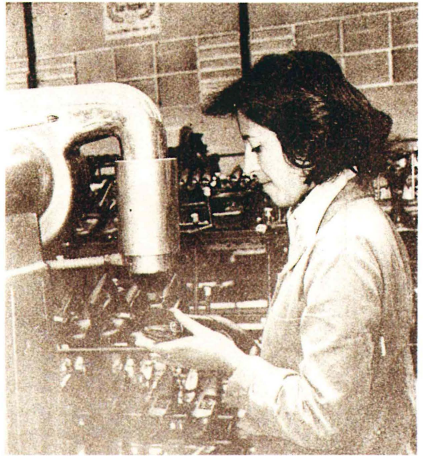
Treballadora en una cadena de fabricació de calçat.

El problema del calçat espanyol no es fonamentava sols en la desfavorable evolució de l'economia mundial, bona part del problema era l'elevada concentració d'aquesta indústria a la província d'Alacant (56% de les empreses del sector) i l'excessiu abús que es feia de l'economia submergida, és a dir, els 15-20% dels treballadors clandestins que es dedicaven a la fabricació de calçat. En canvi, la majoria dels autors no senyalen aquestes com les causes prioritàries del problema, que semblen més bé una justificació per part del Govern. Parafraçant a Roque Moreno, els increments salarials a la segona meitat dels setanta, unit amb l'augment del preu de les matèries primeres a 1978, han tingut com a principal conseqüència la reducció dels beneficis empresarials, la pèrdua de competitivitat davant l'augment dels preus, la menor disponibilitat de capital per a noves inversions i agudització de l'economia submergida, molt unida al tipus d'organització de la fabricació: la subcontractació. Així, varen ser desenes de fàbriques, grans i petites, les que al llarg del període 1977-79, i més concretament al any 79, hagueren de declarar-se en crisi.