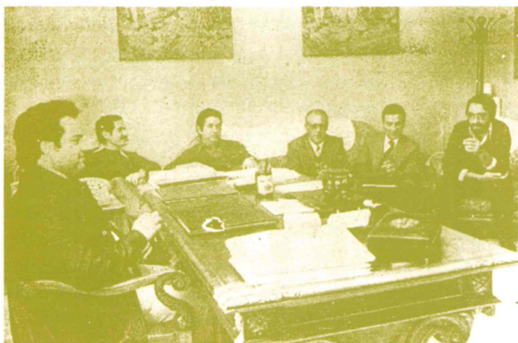
Los alcaldes zapateros se reunieron ayer en Elda: ya hay un frente municipal para luchar contra la crisis.

«Los pueblos del Valle se hunden en el caos más grande» manifestava l'alcalde eldenc. El mateix, en un document dirigit a les autoritats centrals, reclamava com a única solució possible declarar la comarca «zona de preferent localització industrial» amb la fi de donar un impuls a la creació de polígons industrials que afavoriren les economies externes a la nostra comarca, necessàries per a produir un clima industrial favorable a la instal·lació i permanència de fàbriques. S'apropaven els vuitanta i cabria esperar un canvi radical per millorar les expectatives fabrils de la comarca, els plans de reconversió i reindustrialització de la nova dècada serien determinants per a l'estabilitat econòmica a la zona.