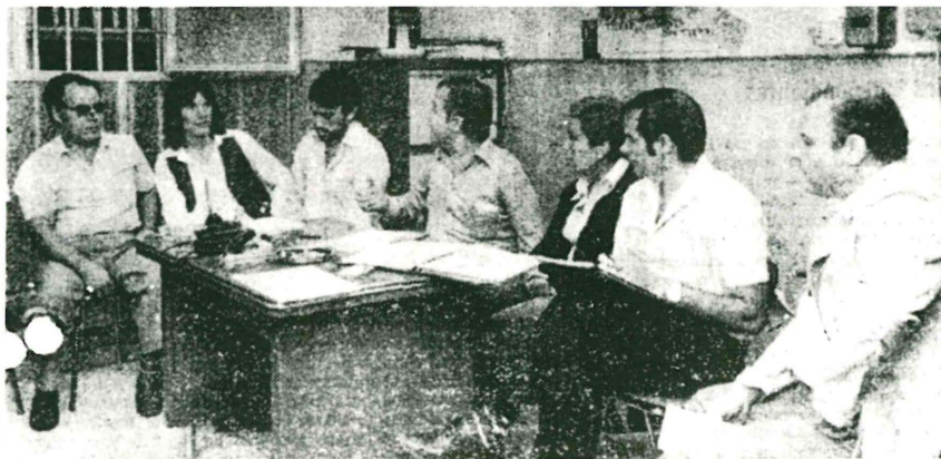
Las tres centrales iniciaron el "proceso de debate sobre la crisis del calzado" en los locales de USO. El próximo sábado habrá una nueva reunión.

Las centrales sindicales cierran filas en busca de la unidad desde la que abordar la crisis