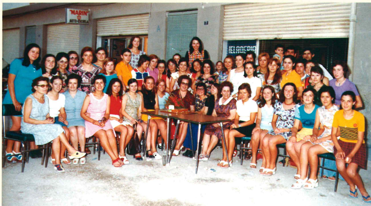
Ocupació intensiva de mà d'obra. Grup de treballadores de la fàbrica de Lito als anys setanta

situació de crisi, des d'un complex context nacional marcat per la transició política i econòmica, una decadència de l'activitat mercantil al món, una estructura empresarial i uns empresaris desfasats o, simplement, un suport del Govern que mai va existir. Motius com aquestos son els que ens motiven a conèixer el grau de certesa de la crisi, les mesures per a evitar-la per part del Govern i el rebuig a aquestes per part de l'oposició, sindicats i moviments juvenils aprofitant una llibertat d'expressió recentment encetada. En definitiva, un repàs a l'ordenació industrial de la nostra comarca per part dels poders polítics i algunes de les postures que adoptaren els treballadors i sindicats d'ací, que per aleshores tenien un poder de concentració i una mobilització social envejable, possiblement, la més forta de la província alacantina.