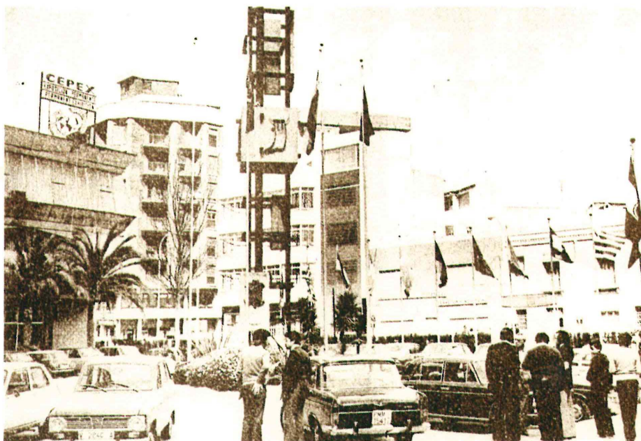
Edifici de la FICIA. Març 1979.