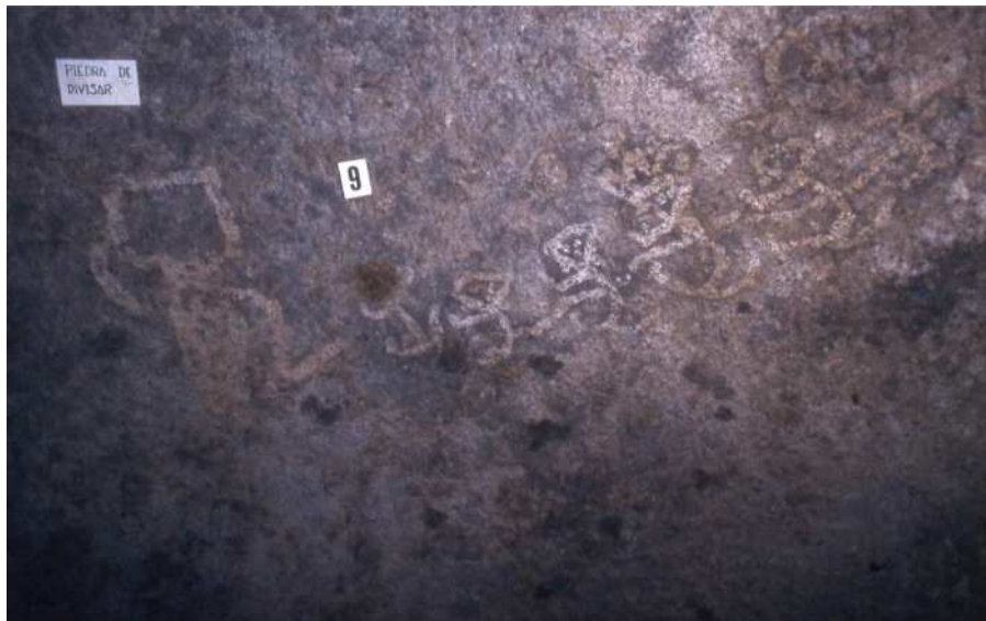
Figura 9. Escena en la que se observa un personaje antropomorfo llevando atados a otros más pequeños. Alero El Bosquecillo 1.