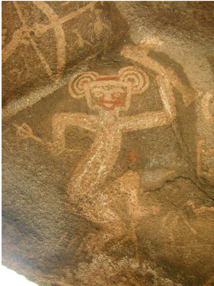
Figura 5. Motivo conocido como “El Danzarín”. Alero La Sixtina.