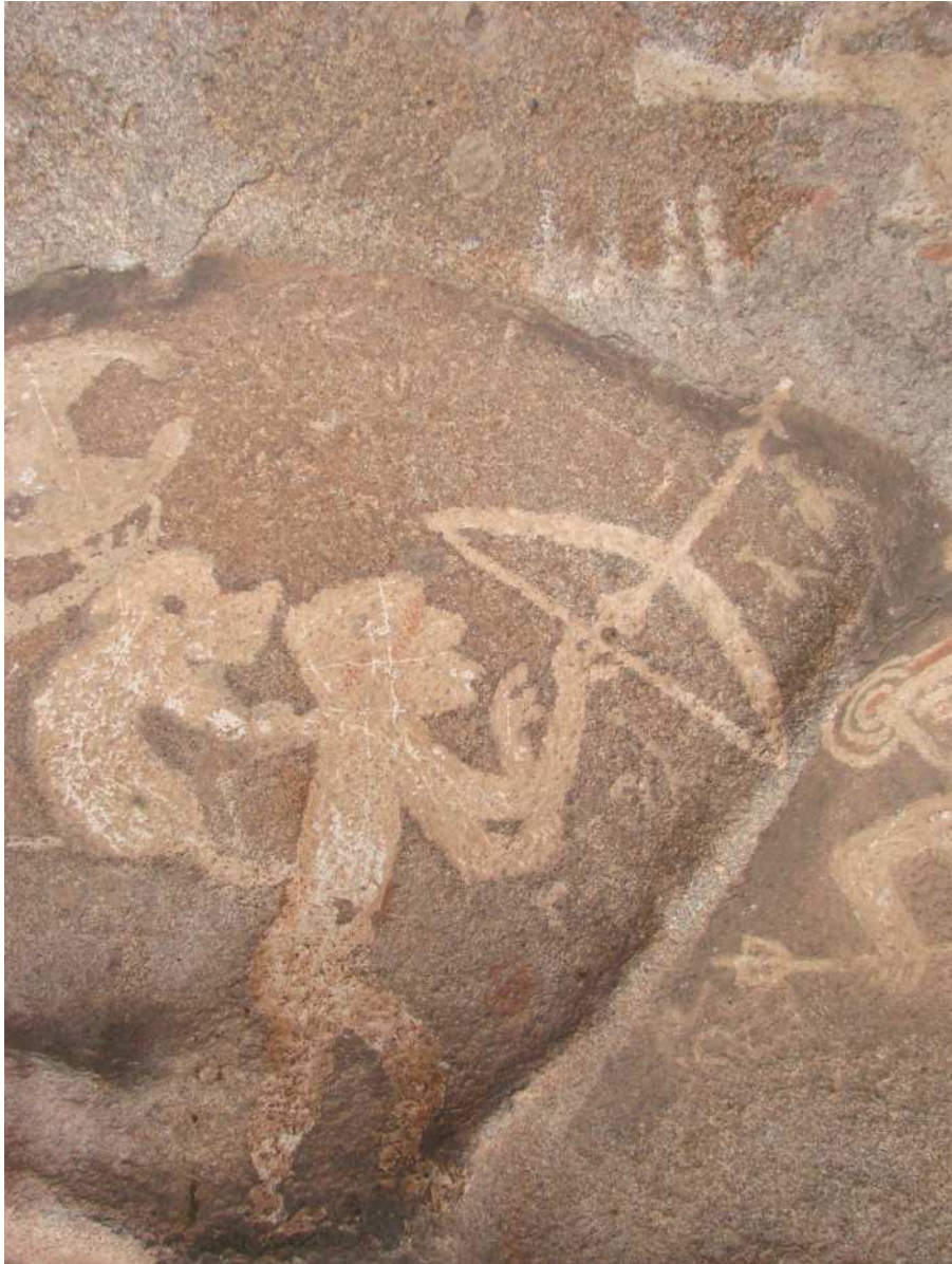
Figura 7. Personaje antropomorfo portando arco y flecha, se destaca un motivo zoomorfo en su espalda. Alero La Sixtina.