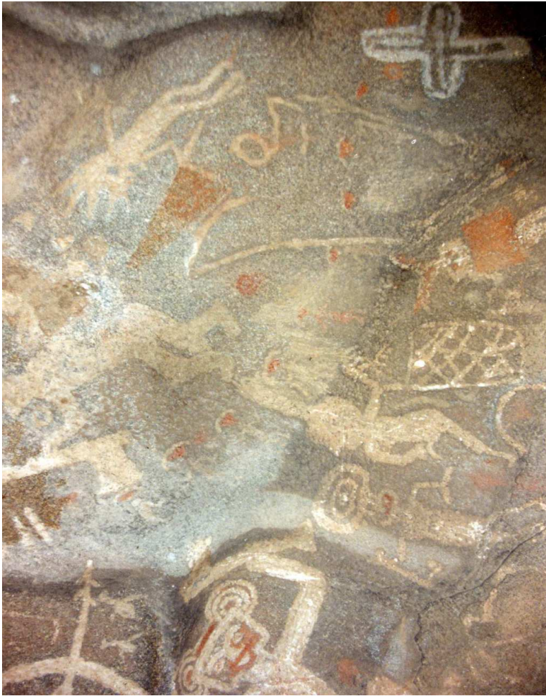
Figura 4. Escena compuesta por catorce pequeños motivos antropomorfos tomados de la mano en actitud de baile. Alero La Sixtina.