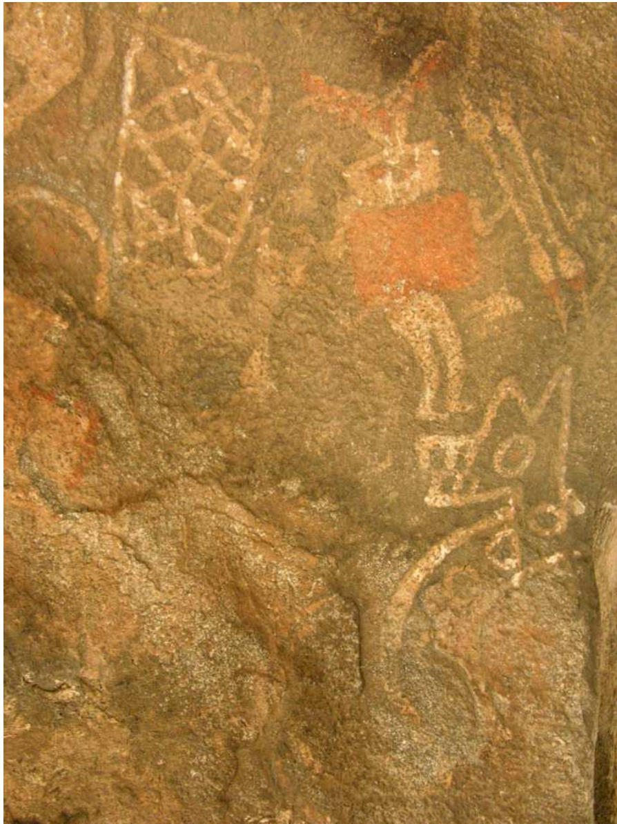
Figura 6. Motivo antropomorfo. Alero La Sixtina.