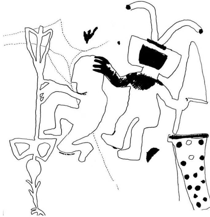
Figura 8. Calco de una pictografía que muestra una escena de sacrificio. Alero La Sixtina.