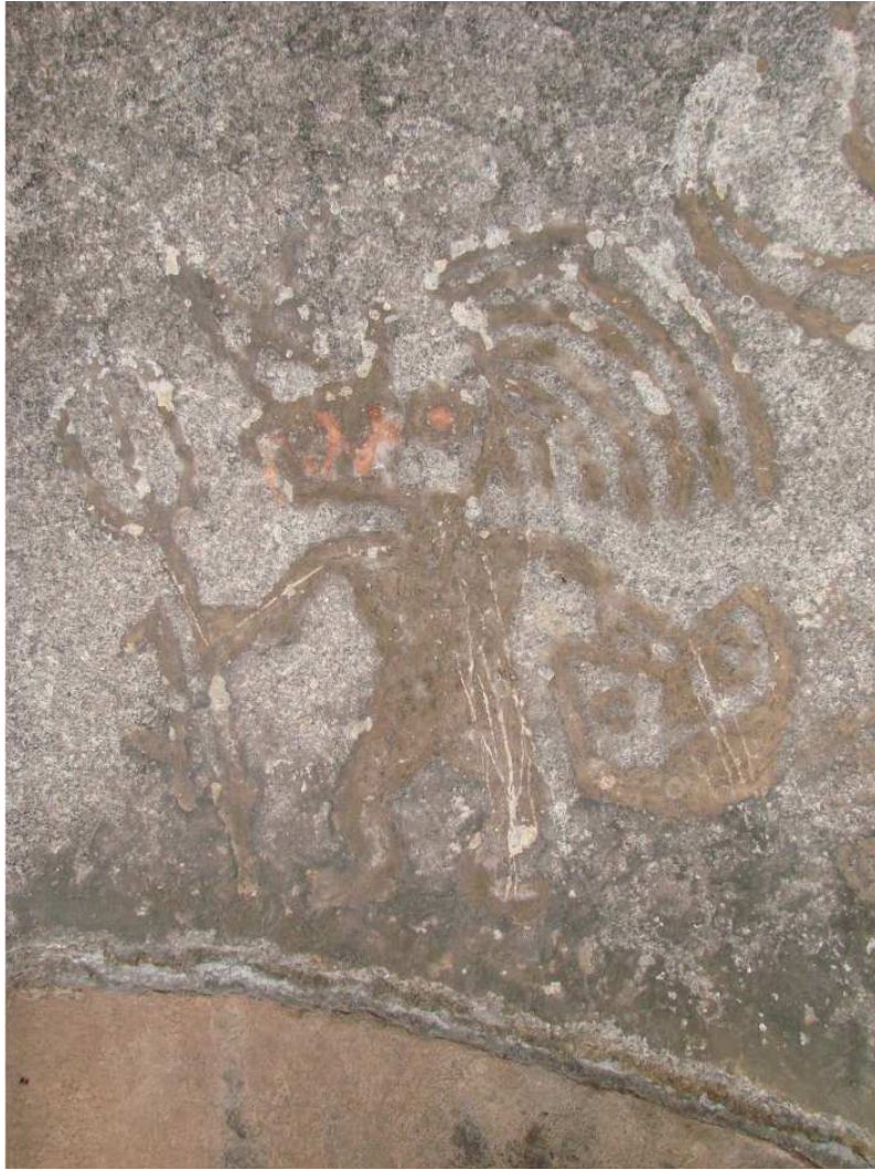
Figura 3. Personaje con rasgos felínicos portando armas y cabeza trofeo. Cueva El Hornero.