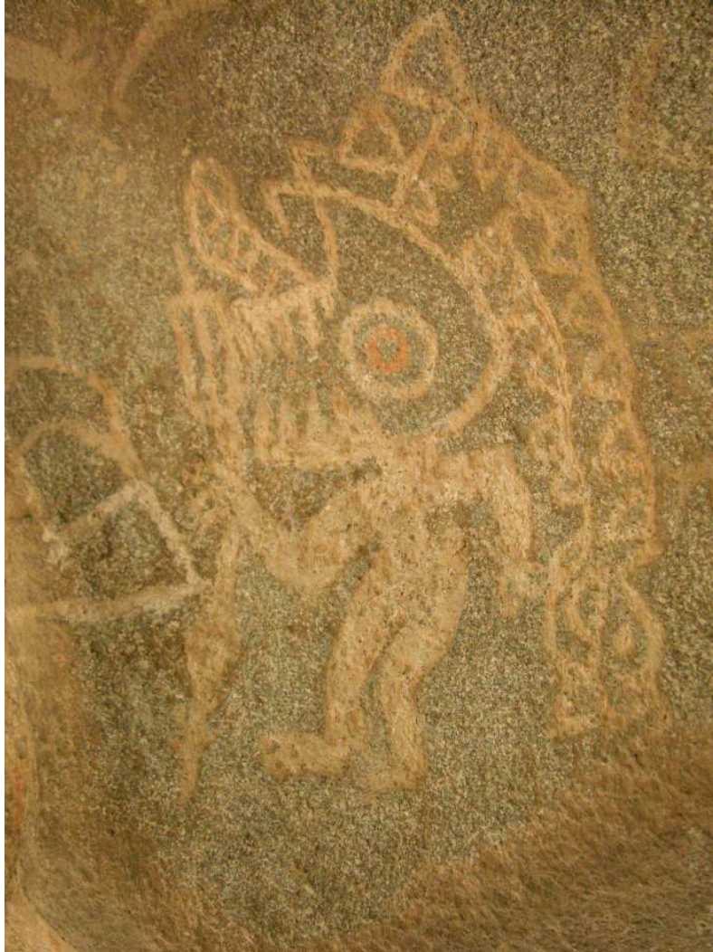
Figura 2. Personaje con máscara felínica. Alero La Sixtina.