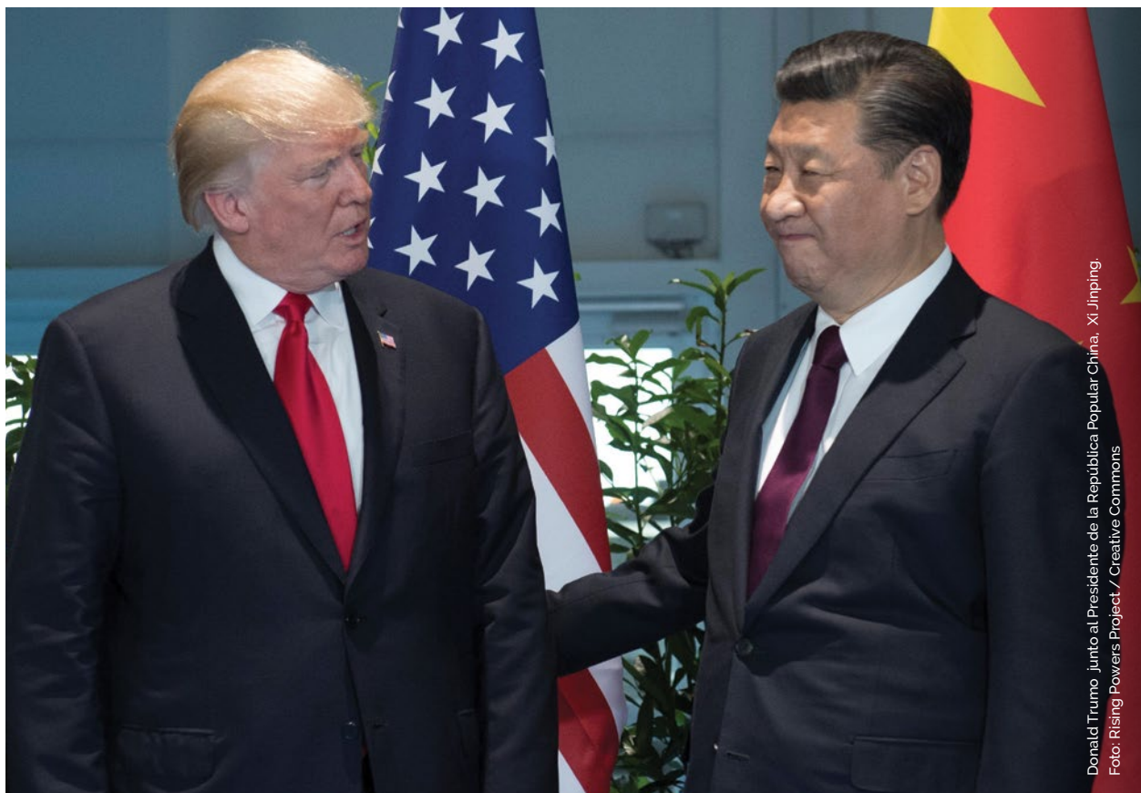
Donald Truimo junto al Presidente de la Republica Popular China, Xi Jinping.

El "choque de modernizaciones", así como la mutua cooperación, no elimina las relaciones político-militares entre los estados y el "choque de civilizaciones". Ambos siguen desarrollándose a otro nivel, tan importante