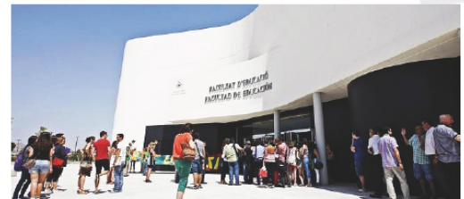
Figura 1. Modelo de ficha taller práctico Facultad nueva de educación. Introducción

En este Taller Práctico de Accesibilidad e Igualdad en el Diseño Urbano y Arquitectónico pretendemos, mediante estas fichas que os presentamos, poner a prueba al edificio de la Facultad de Educación ¿pasará el examen?