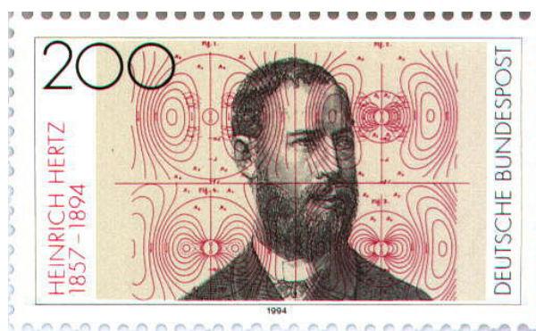
FIGURA 1. Sello conmemorativo del centenario del fallecimiento de Heinrich Rudolf Hertz, emitido en 1994 por el servicio postal alemán. Se observan las líneas de campo eléctrico y magnético emitidas por un dipolo eléctrico oscilante.

Los dos campos están en fase y además no son independientes entre sí, en cada punto del espacio el módulo del campo eléctrico es igual al del campo magnético multiplicado por la velocidad de propagación de la onda electromagnética, lo cual no quiere decir que el campo eléctrico es mucho mayor que el magnético, porque estos campos se miden en unidades diferentes por lo que no se puede comparar su módulo. La existencia de las ondas electromagnéticas fue puesta de manifiesto por el físico alemán Heinrich Rudolf Hertz (fallecido a los 36 años) en Kiel entre los años 1885 y 1888, veinte años después de que James Clark Maxwell las predijera a partir de sus famosas ecuaciones. La contribución de Hertz ha permitido el desarrollo de las telecomunicaciones de una manera que probablemente ni él intuyó (Berkson 1981; Hertz 1893).