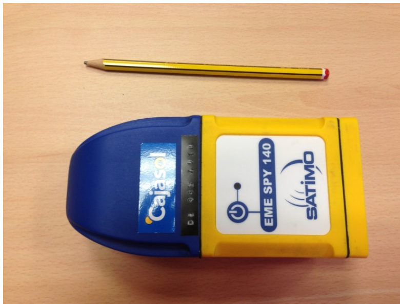
FIGURA 2. Exposímetro Satimo EME Spy 140 utilizado en nuestro experimento.

Disponemos de un exposímetro SATIMO EME Spy 140 del cual mostramos una foto en la Figura 2. Tiene unas dimensiones de 168.5 mm (altura) x 79 mm (longitud) x 49.7 mm (anchura) y una masa de 410 g. Es decir, es del tamaño de un bote de gel mediano. Sólo tiene un botón, el de encendido, y se puede acceder a sus datos mediante un cable y una conexión micro USB.