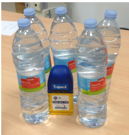
FIGURA 6. Exposímetro midiendo las ondas de RF que inciden sobre él estando rodeado por botellas de agua. Vista frontal, se ha desplazado una de las botellas para verlo mejor.

Estas medidas las vamos a recapitular en la Tabla II en la que también añadimos los máximos legalmente permitidos en zona urbana. En la segunda columna de esta tabla usamos la unidad del Sistema Internacional para la intensidad de una onda ( \text{W}/\text{m}^2 ). Como los números que manejamos son bastante pequeños hemos añadido una columna en la que expresamos la intensidad en una unidad más adecuada para que los números sean fácilmente manejados por los alumnos ( \text{mW}/\text{m}^2 ). Algo análogo se hace en el estudio de los circuitos eléctricos cuando la corriente es muy pequeña y se mide en mA en vez de en A.