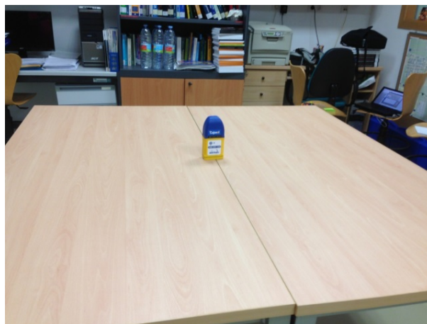
FIGURA3. Exposímetro midiendo las ondas de RF que inciden sobre él.

Para facilitar la interpretación de los datos (recordemos que estamos diseñando un experimento para alumnos de los primeros cursos de universidad) hemos tomado la siguiente decisión: aunque el exposímetro mide 14 bandas diferentes, vamos a considerar la intensidad total, sumando las 14 bandas. Con lo cual vamos a manejar un único número por cada medida. Con esta convención, la intensidad de esta primera etapa es 0.0226 \text{ W/m}^2 . El exposímetro trabaja con mucha mayor precisión, pero consideramos que 4 cifras decimales son suficientes para expresar los resultados en \text{W/m}^2 .