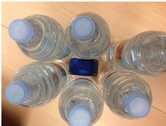
FIGURA 5. Exposímetro midiendo las ondas de RF que inciden sobre él estando rodeado por botellas de agua. Vista cenital.

Etapa 3: En esta etapa repetimos las mismas medidas de la etapa 2; pero con botellas de agua rodeando totalmente el exposímetro en vez de personas. Queremos ver la influencia que tiene el agua a la hora de medir la intensidad de las ondas de RF. Como la densidad del cuerpo humano es ligeramente superior a la del agua queremos comparar estos valores con los obtenidos en la etapa 2. En las Figura 5 y 6 podemos ver la colocación del exposímetro. La intensidad total medida en este caso es de 0.0017 \text{ W/m}^2 .