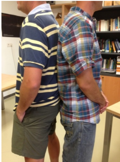
FIGURA 4. Exposímetro midiendo las ondas de RF que inciden sobre él estando colocado entre dos de los autores del trabajo. El exposímetro no se puede ver al quedar totalmente emparedado.

los objetos metálicos: monedas, cinturones, bolígrafos y, por supuesto, de teléfonos celulares. En la Figura 4 podemos ver a dos de los autores del trabajo con el exposímetro entre ellos. La intensidad total medida en esta etapa es de 0.0012 \text{ W/m}^2 .