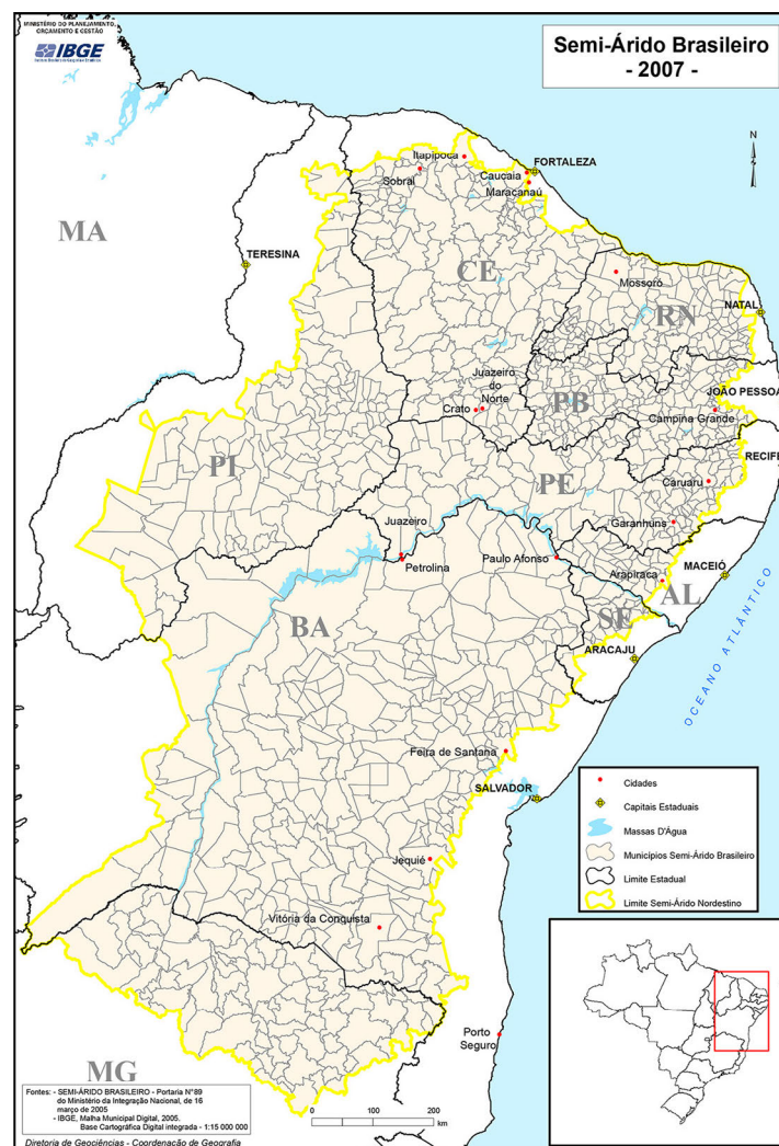
Figura 2. Delimitación y localización del Semiárido en Brasil

Fuente: Instituto Brasileiro de Geografia e Estatística (IBGE). Localización de Paulo Afonso incluida por el autor.