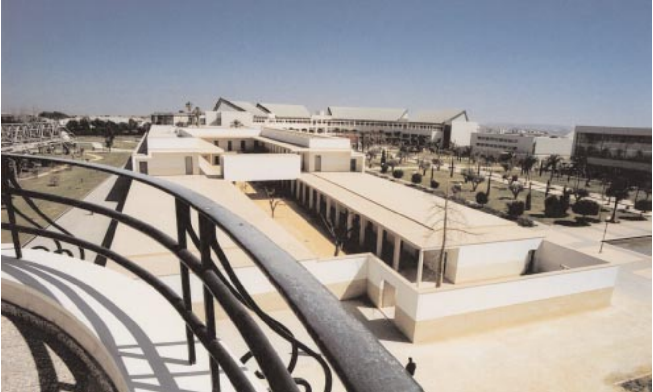
El edificio de Rectorado visto desde el Aeroclub