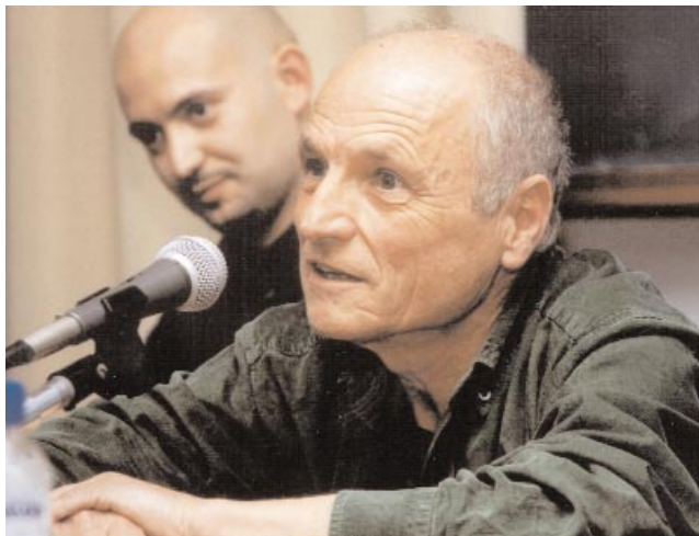
Arriba, Antonio López. Javier Reverte, abajo