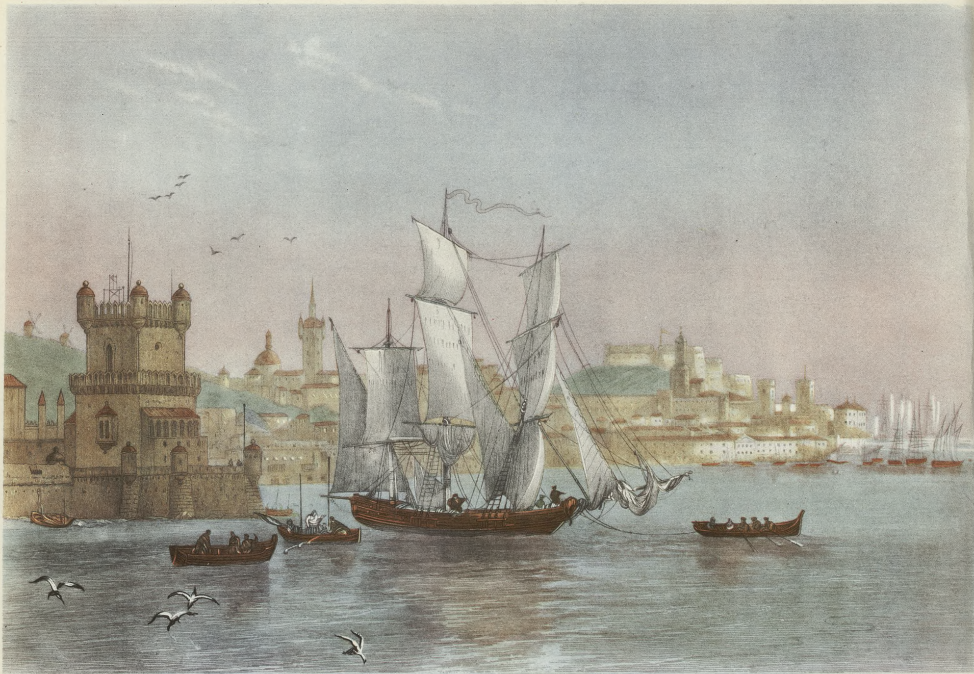
En las páginas 12 y 13, reproducimos dos magníficas fotografías de la ciudad imperial de Toledo, por V. Salas.—En esta página, dos grabados antiguos del estuario del Tajo (Lisboa).

Los que hayan vivido cerca del Tajo, en Toledo, que es donde es más Tajo, donde madura y se carga de historia y de porvenir, han observado al caer la tarde un rumor sordo y complejo como el que ahora, mientras escribo, se eleva desde el cauce entrecortado de presas y se dilata por los campos vecinos, a veces hasta muchas leguas más allá. Es el mismo rumor que sube también desde el hondo del Darro hasta la Alhambra cuando anochece. Y de todos los ríos que arrastran, mezclado con el agua, el eco misterioso de los mitos.