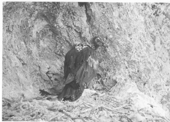
Figura 4. Fotografía del primer pollo de quebrantahuesos anillado en España (junio de 1958)

En la figura 4 se puede contemplar, en una de las inéditas fotografías de Cano, el primer pollo de quebrantahuesos anillado en España.