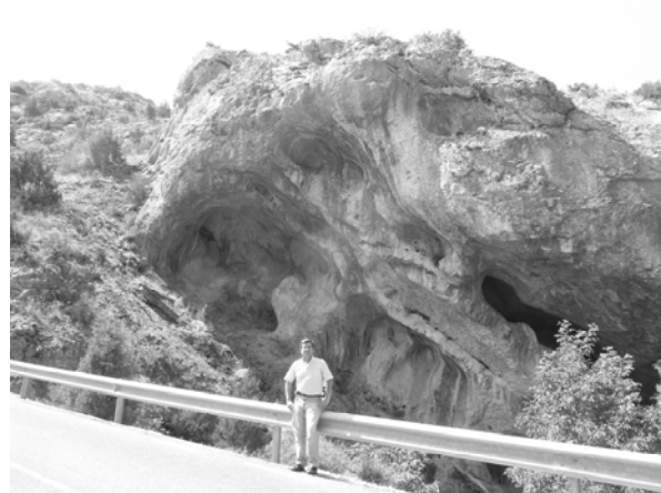
Figura 3. Fotografía del lugar de nidificación del quebrantahuesos de Silos y, en primer término, el autor de este artículo

ochenta y cinco años después de su última ocupación.