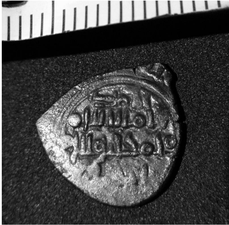
Fig. 4a. Anverso de la moneda andalusí hallada en la excavación.