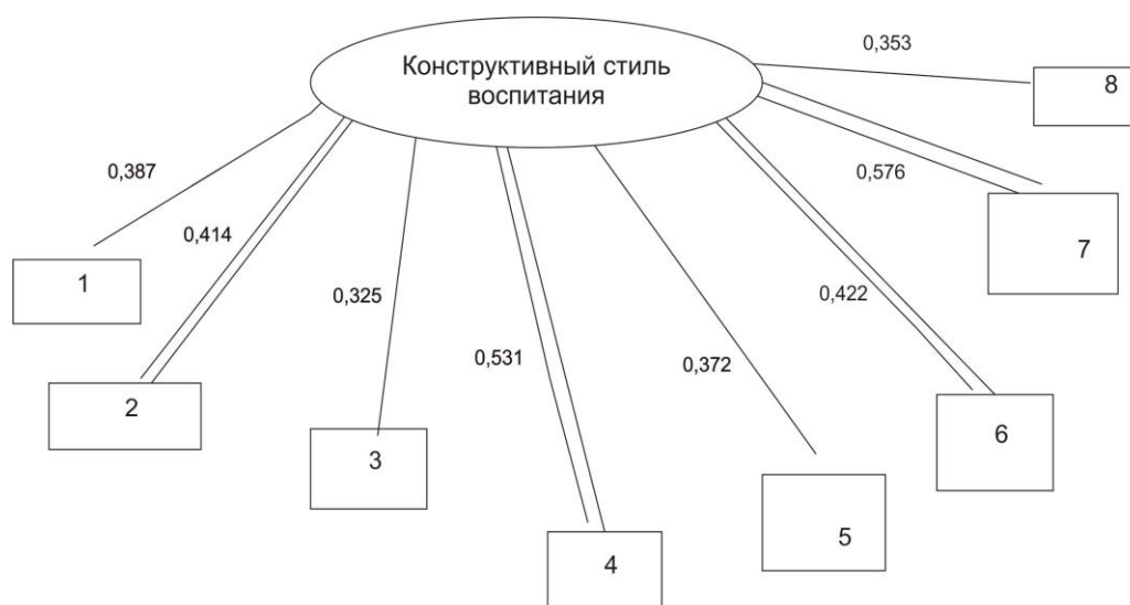
Рис. 3. Корреляционная плеяда связей страхов старших дошкольников с конструктивным стилем родительского воспитания

Примечание: 1 – социальные страхи; 2 – общее количество страхов; 3 – пространственные страхи; 4 – страх персонажей; 5 – боязнь животных; 6 – страх темноты; 7 – страх смерти; 8 – страх физического ущерба.