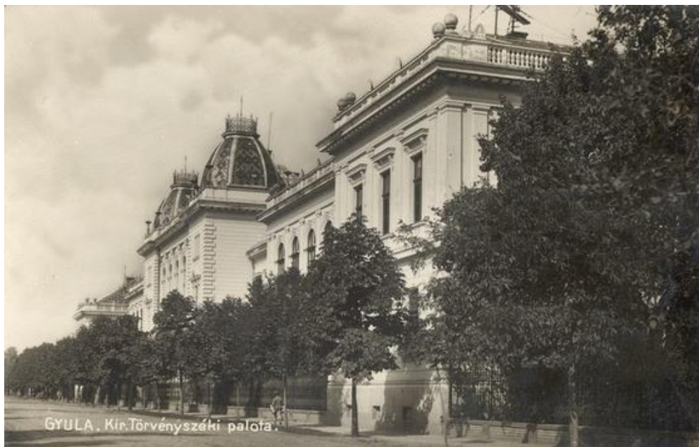
1.kép. A Gyulai Királyi Törvényszéki palota.