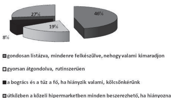
2.ábra Előkészületi döntések (eszköz)

Az eszközöket inkább rutinszerűen, a nyersanyagokat pedig jellemzőbben gondosan listázva tervezték meg. (3. ábra)