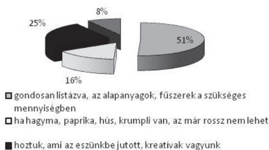
3.ábra Előkészületi döntések (nyersanyag)

Saját és vállalati járművet használtak a közlekedésben. A rendezvény sikerét mutatja, hogy 25% és 100% között szóródva átlagosan 77,6%-os bizonyossággal jövőre is ellátogatnak a rendezvényre a válaszadók.