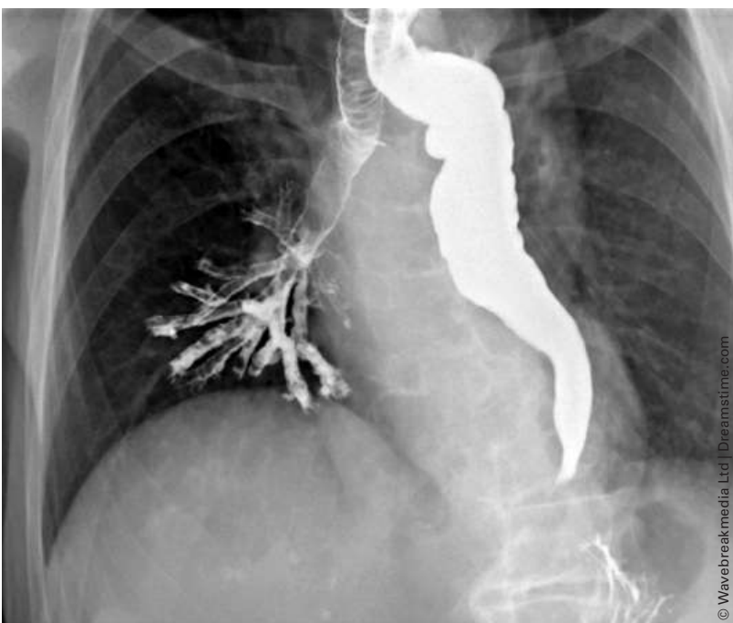
Figure 1: Extrait du transit œso-gastro-duodénal au baryum réalisé chez la patiente.

Plus complexe, une manométrie à haute résolution et impédance (HRMZ) permet une analyse fine des dysmotilités œsophagiennes en donnant une représentation topographique des variations de pression. Une PH-métrie par téléométrie pour diagnostiquer une maladie de reflux n'est pas indiquée en absence d'atteinte inflammatoire endoscopique expliquant la dysphagie. Enfin, un CT-scan cérébral à la recherche d'un nouvel événement ischémique responsable de troubles de la déglutition oro-pharyngée n'est pas demandé en priorité en absence d'argument clinique.