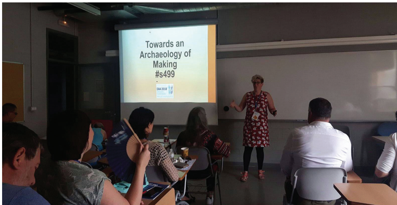
Figura 4. Sessió Towards an archaeology of making del dia 8 de setembre de 2018.

aquestes connexions... per alguna cosa el congrés tenia el lema de "Reflectint Futurs"!