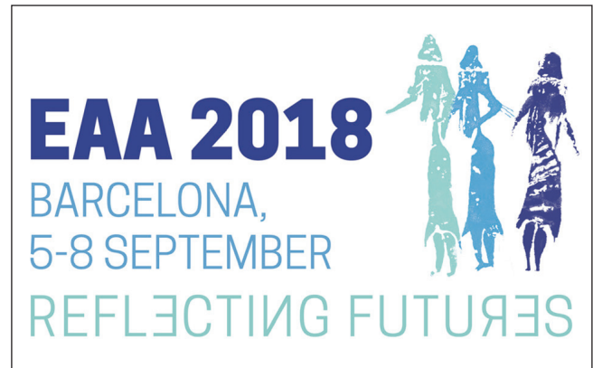
Figura 2. Logotip amb les tres figures femenines de l'abric rupestre de la Roca dels Moros del Cogul.

El termini per proposar sessions per Barcelona es va obrir poc després d'acabar la reunió anual de Maastricht i es va tancar el 13 de novembre de 2017. Fins que no es va poder comprovar el nombre total