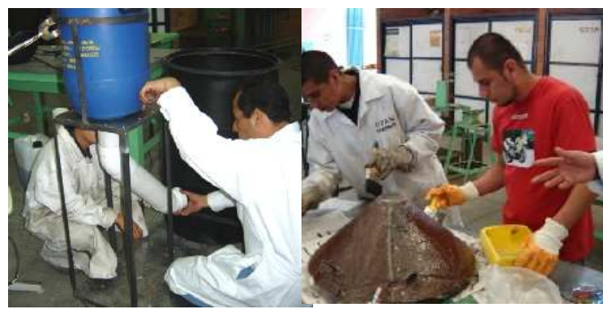
Figura 6. Fabricación de las líneas de alimentación y tapa