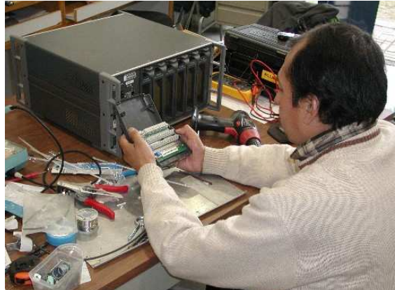
Figura 9.- sistema de adquisición de datos