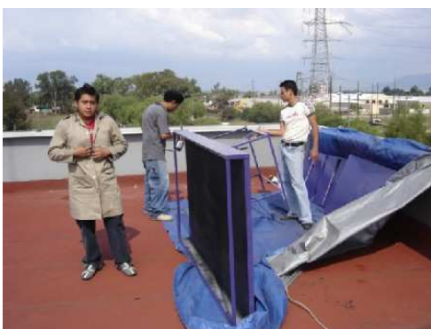
Figura 3.- Colector solar

Se armo una estructura con ángulo de 1^\circ el cual va soldado con electrodo 1360 de \frac{1}{8} " con las siguientes medidas: 1.14 m de ancho y 2 m de largo y 15 cm de alto, el marco superior de la estructura del colector se armo con Tee de 1^\circ para fijar el vidrio, lo que nos brinda mejor estabilidad y ahorro de espacio. La estructura se forro con lámina negra colocando el unicel como pared intermedia entre las dos caras, interior y la exterior. Finalmente se colocó otra placa de unicel y lamina de aluminio pintada de negro para absorber el calor, el diseño original permite cambiar el elemento almacenador por fibra de metal pintado de negro. En la figura 3 se presenta el colector solar.