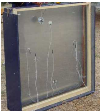
Figura 10.- Muro solar

Biodigestor: Permitirá enseñar y estudiar el proceso de generación de biogás a través de la descomposición de la materia orgánica. Se obtendrán curvas de generación de biogás, modificando el tipo de materia orgánica, su concentración (agua - materia orgánica) y temperatura. En la figura 12 se observa el Biodigestor.