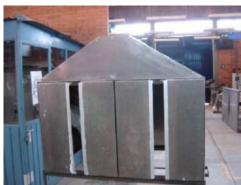
Figura 4. Contenedor