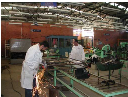
Figura 1.- Armado del esqueleto del modelo

El modelo experimental tiene 2 m. de altura y 1.2 m. de ancho. Su fabricación se llevó a cabo en el LIME II del la FES Cuautitlán. Se hizo un bastidor con solera y ángulo que sirve de soporte a lamina negra. En la figura 1, se observa el proceso de soldado y armado del armazón del modelo.