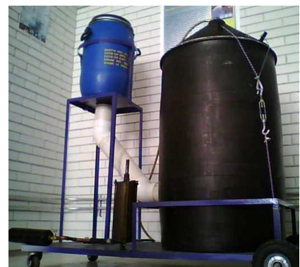
Figura 12.- Biodigestor