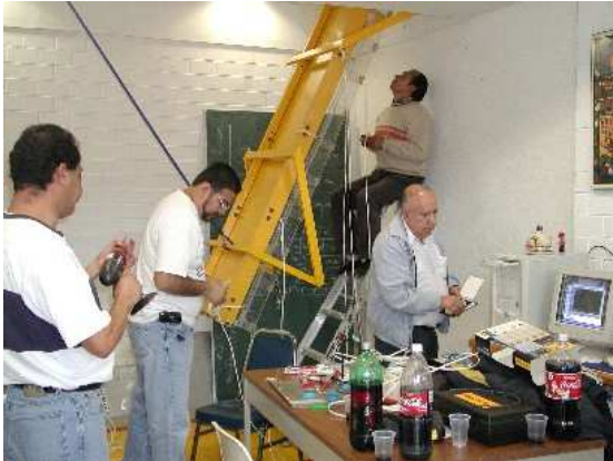
Figura 8.- Colocación de termistores

El sistema de adquisición de datos fue conectado a una computadora, a la cual se le instaló el software correspondiente para el funcionamiento del sistema de adquisición de datos y anemómetro. Para la puesta en marcha, fue necesario hacer el cable de alimentación entre la resistencia eléctrica del prototipo experimental y el variac (equipo de protección). Una vez conectados todos los equipos se realizó una prueba experimental en donde se verificó el correcto funcionamiento tanto de termistores como del anemómetro.