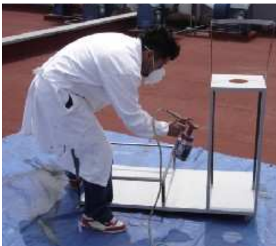
Figura 5. Estructura del Biodigestor

Para obtener mayor información sobre el diseño y construcción del Biodigestor se puede consultar el artículo de González et al (2008)