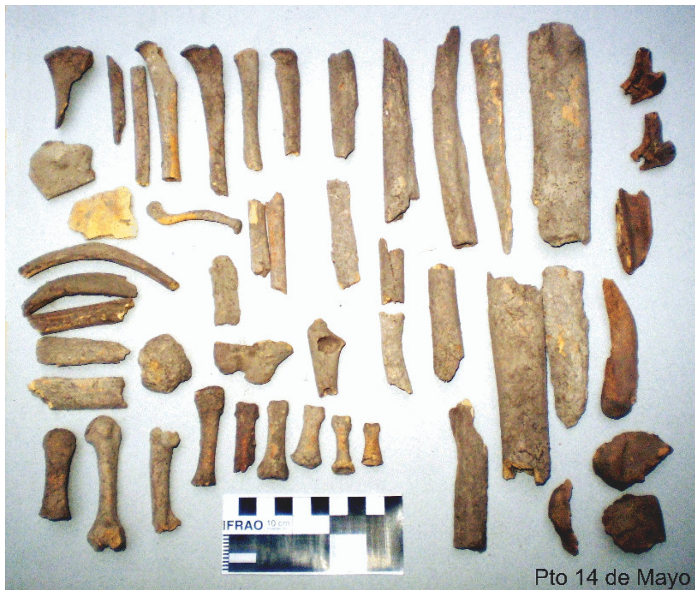
Figura 2. Estado de conservación del material.