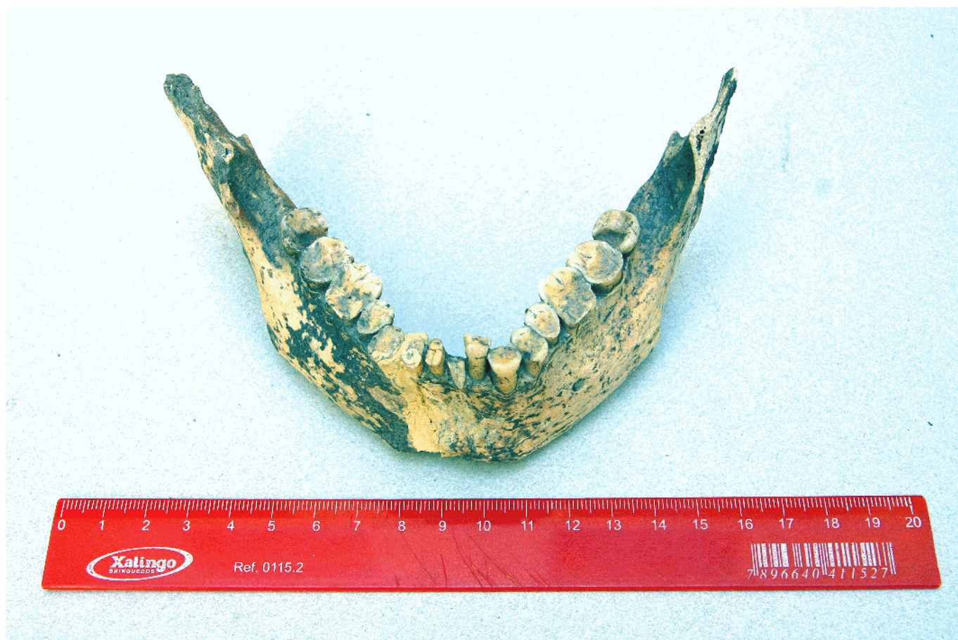
Figura 3. Maxilar inferior con evidencia de desgaste de esmalte.

particular, aquellos grupos con dietas basadas en pescados, moluscos y vegetales que crecen en ambientes litorales presentan una abrasión muy importante debido al stress continuo al que están sometidas sus piezas dentarias a la arena adherida, los fragmentos de valvas y diversos fitolitos (Okumura y Eggers 2005). La angulación de las superficies oclusales así como la exposición de la dentina son rasgos comparables con otras poblaciones de pescadores-recolectores-cazadores de sitios de tipo sambaquí del litoral de Brasil (Machado y Kneip 1994). Estos resultados son congruentes con las propuestas regionales (Lamenza 2013). Asimismo permiten introducir nueva información en una región prácticamente inexplorada en términos arqueológicos y contribuye a la comprensión del marco espacio-temporal de las ocupaciones humanas de las tierras bajas sudamericanas.