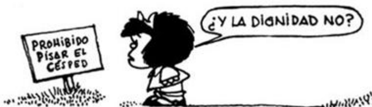
Caricatura de Mafalda por Quino

es algo dado por naturaleza, por el solo hecho de ser humanos, por existir como personas. Un concepto de dignidad por la condición que todas las personas tienen de ser hijos de Dios, lo cual reside en que cada uno debe acatar la ley moral. La moral es así, otra pauta que está en la esfera de la dignidad humana, encargada de calificar o descalificar las conductas de las personas en los momentos de cumplir los deberes que son impuestos por la cultura. La segunda, siendo parte de las relaciones entre los seres humanos donde hay un respeto recíproco, un reconocimiento del otro e intimidad personal. La tercera, como un poder político donde la dignidad quiere velar por la autonomía de los principios, la integridad y la igualdad. Hace referencia la dignidad al valor inherente al ser humano en cuanto ser racional, dotado de libertad y poder creador, pues las personas pueden modelar y mejorar sus vidas mediante la toma de decisiones y el ejercicio de su libertad. La dignidad refuerza la personalidad, fomenta la sensación de plenitud y satisfacción. Para que esto se cumpla es necesario conocer las posibilidades propias de cada hombre y la libre proyección de la razón humana.