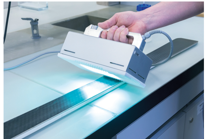
Abb. 3: Das Wachsen eines Skis mit Hilfe einer Quecksilberdampflampe

Die Autoren danken der Kommission für Technologie und Innovation KTI für die finanzielle Unterstützung. Dem Unternehmen TOKO sei für die gute Zusammenarbeit gedankt.