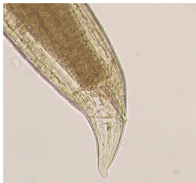
Slika 3 c: Stražnji kraj tijela obličja Contracaecum sp.

Babuška, Carassius gibelio , može biti domaćin različitim svojtama nametnika: praživotinjama (Protozoa) (Djikanović i dr., 2018.), jednorodnim metiljima (Monogenea) (Demir i Karakiši, 2016.), dvorodnim metiljima (Digenea) (Pakosta i dr., 2018.),