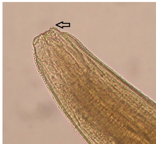
Slika 3 b: Zub između ventrolateralnih usana (označen strelicom)

maksimalnih 1078 jedinki, u prosjeku 424,66 obličja po ribi. Dužina jedinki Contracaecum sp. kretala se od 1,5216 mm do 6,8228 mm (prosječno 4,146 mm), a širina od 0,8464 mm do 2,9701 mm (prosječno 1,9418 mm). Ukupna biomasa obličja kretala se od minimalnih 307,86 µg do maksimalnih 141659,98 µg. Utvrđena je pozitivna statistički značajna korelacija između mase ribe i ukupne biomase obličja ( r_s = 0,667 ; p < 0,05 ). Broj obličja po ribi (abundancija) je pozitivno korelirao s masom ribe ( r_s = 0,633 ; p < 0,05 ), tj. veće ribe sadržavale su i veći broj obličja.