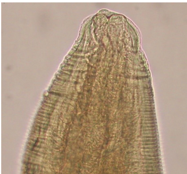
Slika 3 a: Prednji dio tijela obličja Contracaecum sp. na kojem su vidljive tri usne i naborana kutikula.

trakavicama (Cestoda) (Japoshvili i dr., 2017.), obličjima (Nematoda) (Shukerova, 2005.; Daghigh Roohi i dr., 2014.; Demir i Karakiši, 2016.; Djikanović i dr., 2018.; Pakosta i dr., 2018.; Innal i dr., 2020.), pijavicama (Hirudinea) (Arslan i Emiroğlu, 2011.), ličinačkom stadiju školjkaša (Bivalvia) (Pakosta i dr., 2018.) i rakovima (Crustacea) (Daghigh Roohi i dr., 2014.). Raznolikost nametnika babuški Sakadaškog jezera je relativno niska u usporedbi s babuškama jezera Marmara u Turskoj u kojima je pronađeno šest svojti (Demir i Karakiši, 2016.) ili babuškama dunavskog bazena Srbije gdje je utvrđena prisutnost devet svojti nametnika (Djikanović i dr., 2018.). Također, veći broj nametničkih svojti (11) je