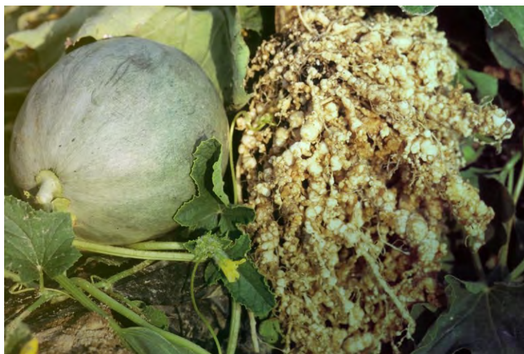
Slika 1. Kvržice uzrokovane nematodama korjenovih kvržica ( Meloidogyne spp.) na korijenu tikve

Razvoj simptoma na biljkama ovisi o visini populacije, osjetljivosti domaćina i uvjetima okoliša. Primjerice, kod visoke inicijalne populacije nematoda, klijanci ili presadnice mogu se od početka slabo razvijati, venuti i sušiti se. Kod niže inicijalne populacije nematoda ekspresija simptoma može biti odgođena do viših stadija razvoja biljke, a u međuvremenu se brojnost nematoda povećava.