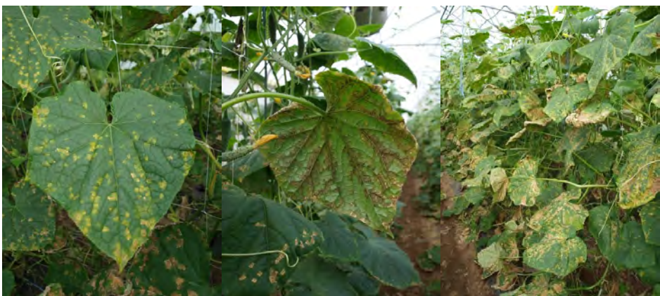
Slike 4, 5 i 6. Simptomi plamenjače na licu i naličju salatnih krastavca (lijevo i sredina) te jača pojava bolesti u nezaštićenih biljaka salatnih krastavca u negrijanom plateniku (desno)

Iskustva primjene mjernog uređaja ("Paar") u Savinjskoj dolini u susjednoj Republici Sloveniji pokazuju da prije početka epifitacije moramo registrirati barem jednu do dvije primarne zaraze ili više uvjeta za formiranje sporangija. Prikupljanjem informacija o danima infekcije i izračunom trajanja inkubacije može se uštedjeti 30-40 % fungicida u odnosu na redovite tjedne aplikacije (Dolinar, 1993.). Uz praćenje vremenskih uvjeta važno je pronaći prve simptome bolesti i prvu fruktifikaciju (Cohen, 2011.). Višegodišnjim praćenjem zdravstvenog stanja krastavaca kornišona prilikom uzgoja na otvorenom u Međimurju značajnije propadanje nezaštićenih biljaka bilježimo u drugoj polovici mjeseca srpnja i/ili na početku kolovoza (Slike 1, 2 i 3), što je u korelaciji s ljetnim vremenskim uvjetima (Tablica 2). Naknadno se bolest jače razvija prilikom uzgoja salatnih krastavca u negrijanim plastenicima (Slike 4, 5 i 6).