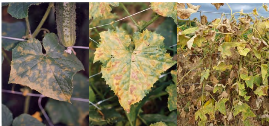
Slike 1, 2 i 3. Početni simptomi plamenjače (lijevo), početak nekroze lista (u sredini) i sušenje lišća kod nezaštićenih krastavca kornišona prilikom uzgoja na otvorenom (desno)