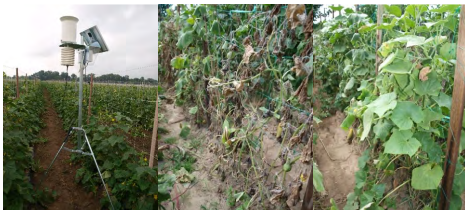
Slike 7, 8 i 9. Mjerni uređaj za prikupljanje meteoroloških podataka bitnih za prognozu pojave i optimalnih rokova suzbijanja plamenjače pri otvorenom uzgoju krastavca kornišona (lijevo). Prva iskustva primjene mikrobioloških pripravaka ( Glomus sp. , Bacillus sp. ) i biljnih ekstrakta (vrba, kopriva) pokazuju određenu djelotvornost na plamenjaču krastavca kornišona (na slikama u sredini i desno – izgled netretiranih i tretiranih biljaka 31. srpnja 2017.).