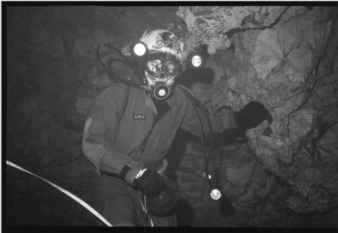
U Ciginom sifonu

Tijekom kampa špilja je posjećena nekoliko puta. Osim fotografiranja vršena su arheološka i biološka istraživanja. Tročlana ekipa ulazi u špilju s namjerom da transportira ronilačku opremu i zaroni u veliki sifon. Prolaz kroz sjeverni sifon bio je otvoren pa se u njemu nije trebalo roniti. Pri dolasku na veliki sifon ustanovilo se da nešto nije u redu s ventilom na boci pa se odustalo od ronjenja. Gospodska špilja je dobro poznat i već istražen arheološki lokalitet. Površinski se ne nailazi na puno nalaza ( kulturni sloj se nalazi u naslagama ispod zasiganog površinskog sloja ) osim u dvorani, gdje se vide ostaci ranije arheološke sonde. Prapovijesna keramika se tu