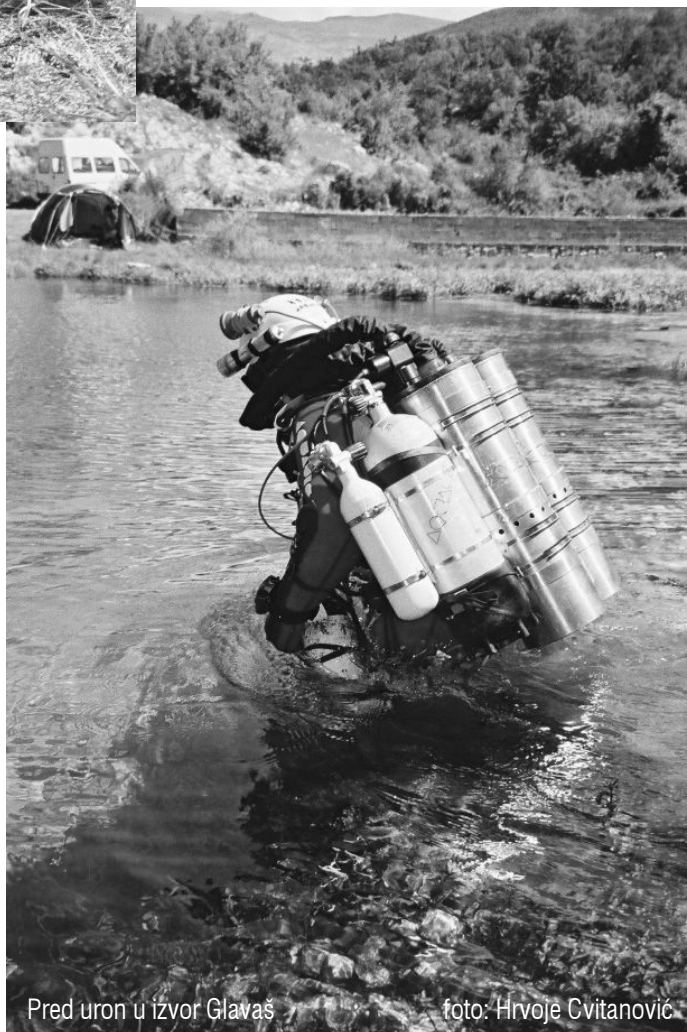
Pred uron u izvor Glavaš

Ronjenje je trajalo od 19. do 22. 8.2004.. To je bilo prvi put za talijansko-švicarski tim da roni na tako divnom mjestu. Dva dubinska ronionca i tri ronionca za logistiku istraživali su izvor Glavaš. Dubinski ronionci su nosili dva ribridera i 7 ili 10 litarske boce od koje su tri bile mješavine 14% kisika, 50% helija. Nitrox i kisik su korišteni za dekompresiju. Istraživački uron je trajao ne duže od 120 min. Donji dio