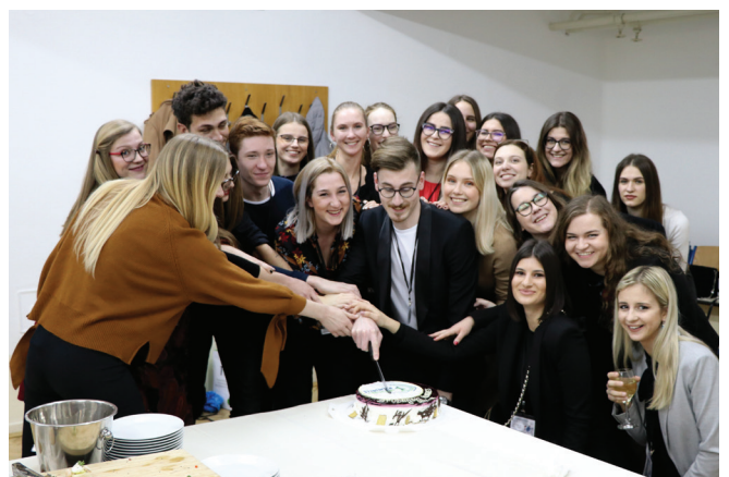
Slika 7 – Organizacijski odbor