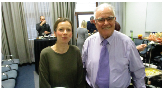
Slika 2 – ...i kraj radionice uz neformalno druženje

Radionica je nastavljena raspravom na temu numeričkoga označavanja radova koji su objavljeni samo u elektroničkom obliku te označavanja stranica, sveščića i svezaka u online izdanjima znanstvenih časopisa. Raspravu je moderirao prof. dr. sc. Neven Duić, glavni urednik časopisa JSDEWES. Sudionici su se dotakli i