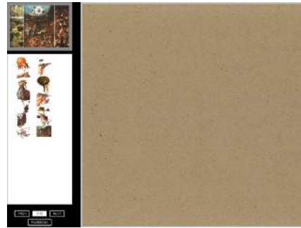
Figura 2: Segundo Layout do protótipo