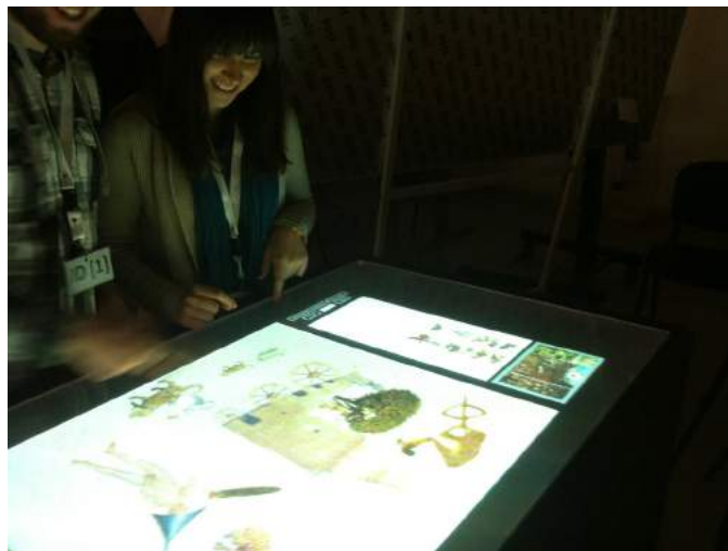
Figura 3: Apresentação da interface na segunda sessão de testes de usabilidade.

Depois de realizadas as alterações enunciadas, foram realizados novos testes que, por serem realizados por pessoas externas ao laboratório, foram considerados como fazendo parte da primeira avaliação de usabilidade e decorreram em laboratório (Preece, 1993; Nielsen, 1993; Dumas & Redish, 1999). Destes testes recolhemos informações que conduziram à inclusão de dois novos botões. Um designado por “Tryptich” que permitia navegar pelas obras presentes e um botão “Restart” que permitia apagar toda a composição. A versão foi testada na realização dos segundos testes de usabilidade, conforme a figura 3. Desta sessão resultou o apuramento da versão final. Na versão final do protótipo foram consideradas alterações ao nível do número de obras utilizado. Ou seja, foi alargado para nove, o número de obras usado, acrescentando-se assim, “O Jardim das Delícias”, “O Navio dos Loucos”, “A Extração da Pedra da Loucura”, “As Tentações de Santo António”, “Mesa dos Pecados Capitais” e “O Viajante”. Sem uma distribuição equitativa do conjunto das oito obras foram retirados