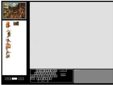
Figura 1: Primeiro Layout do protótipo.

publicadas, passou a ser realizada diretamente no Facebook. Uma outra alteração foi realizada, ao nível da introdução de um novo fundo, com textura de papel. Como o princípio da colagem se encontra fortemente marcado, através da presença dos fragmentos, que na área criativa possibilitam a realização de composições, optou-se por diversificar os fundos, aproximando assim, a colagem digital à imagem de uma colagem manual.