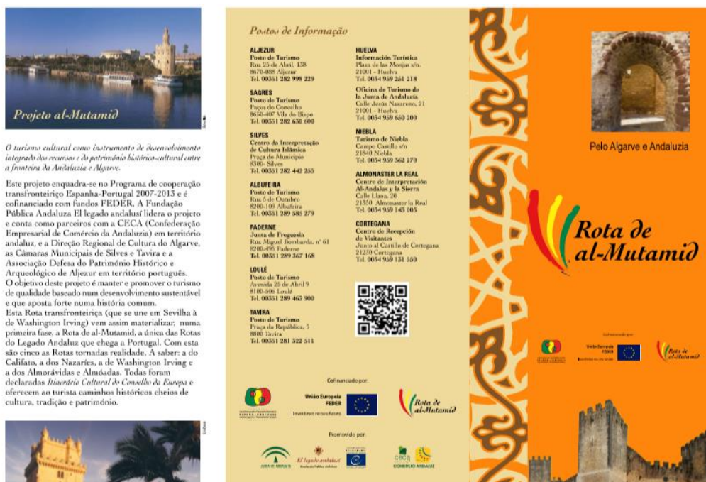
Figura 2 – Folheto da Rota de Al-Mutamid