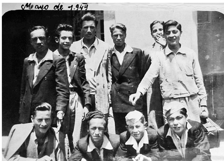
Con sus compañeros de colegio (de pie, cuarto desde la izquierda).

Había otros profesores, ¿fue profesor tuyo el canónigo Flores?