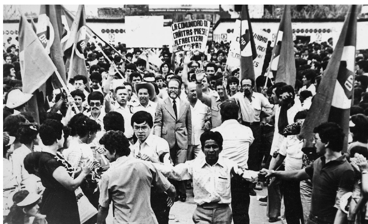
Julio César Trujillo en plena campaña.

Tuve que asumir esa responsabilidad. La ventaja era, en cambio, que tenía una muy buena organización del partido, tanto que a los ocho días de proclamada la candidatura oficialmente teníamos propaganda, a la manera casi doméstica que se hacía entonces, en todas las parroquias del país, en donde se fijaban estos afiches del candidato, lo cual revelaba, ciertamente, una muy buena organización.