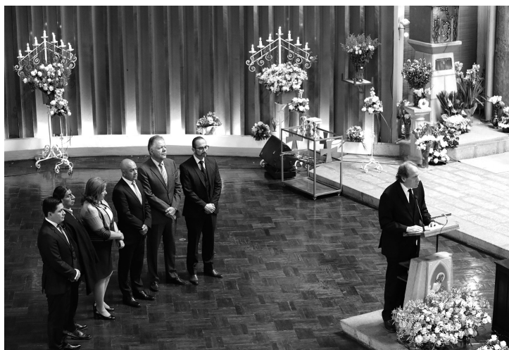
Homenaje del Consejo de Participación Ciudadana y Control Social Transitorio a Julio César Trujillo en el funeral.