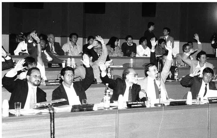
Momento de la votación en la Asamblea Constituyente 1997-1998.

Democrática, por ejemplo, y varios otros del socialismo, y de los indígenas también.