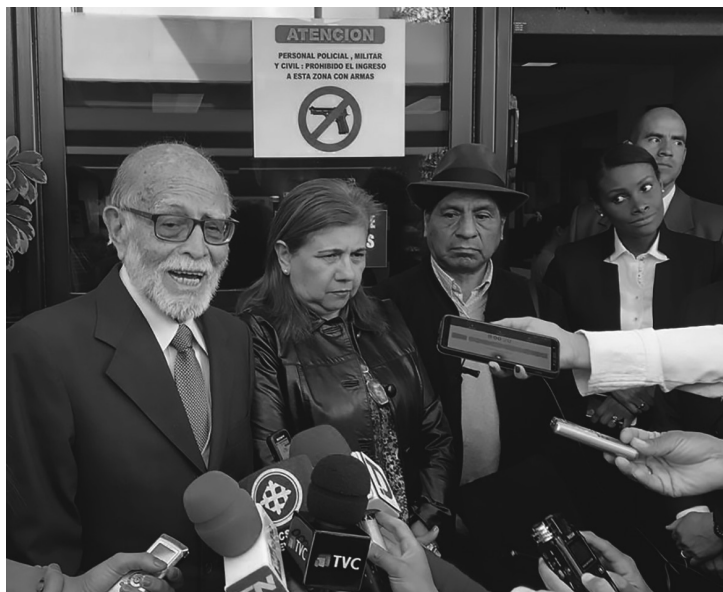
Intervención ante la prensa acompañado de varios miembros del Consejo de Participación Ciudadana Transitorio.