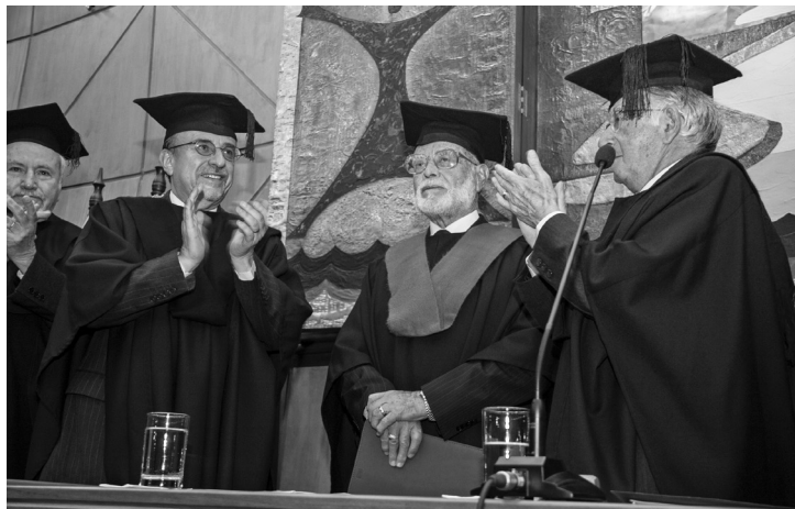
Investidura de doctor honoris causa por la Universidad Andina Simón Bolívar, Sede Ecuador, 2013.

que no contribuyen a la construcción del Ecuador que deseamos sea realidad?