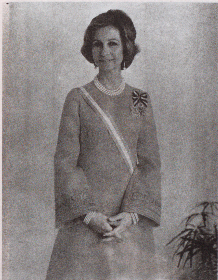
S.M. LA REINA D'ESPANYA, PRESIDENTA D'HONOR DEL CONCURS INTERNACIONAL DE CANT "FRANCISCO VIÑAS"

GENERALITAT DE CATALUNYA, GOVERNAMENT D'HONOR DEL CONCURS INTERNACIONAL DE CANT "FRANCISCO VIÑAS"