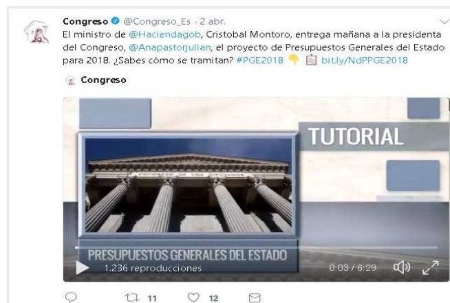
Fuente: API de Twitter.