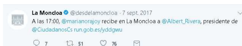
Imagen 4: Administración pública.