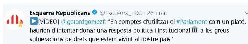
Imagen 3: Un partido político.

Finalmente, el caso más relevante es el de los iconos. Se observa en la tabla 2 una relación de los más usados. Se refleja un número importante de medios (cámaras, micrófono, blocs...) y flechas y su uso se incrementa cuando se apela directamente al receptor. Es significativo el uso del edificio clásico como símbolo del Parlamento ofreciendo una consideración especial y un refuerzo de la institución por actores diferentes ideológicamente tal y como se ve en las Imágenes 3, 4 y 5.