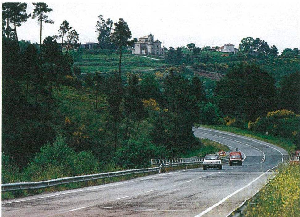
La nueva iglesia de Loeda junto a la carretera nacional

te evolucionado, al concentrar su actividad en la agricultura y en la ganadería minifundista de autoconsumo. Un total de 19 granjas (15 de ganado porcino y 4 de conejos), integradas en el sistema cooperativista de COREN, sirven de base para fortalecer la economía agraria, que ocupa al 48% de la población activa del municipio.