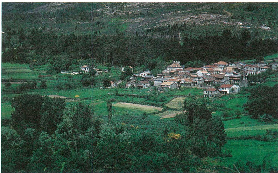
Aldea de Vilar, al pie de los granitos y la sierra

gran belleza. También cabe destacar, por su valor artístico, el antiguo puente medieval sobre el río Arenteiro, la casa señorial de Reda (siglo XVII) y el pazo de Vilaríño, también del siglo XVII.