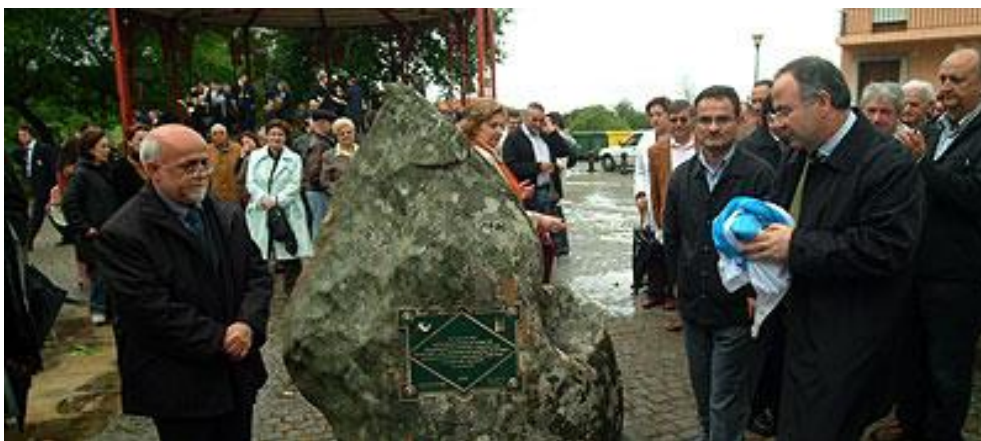
Ilustración 1: Monumento/homenaxe aos presos republicanos.

Por outro, en Lavacolla érguense as terminais do Aeroporto de Santiago de Compostela (antiga e aínda hoxe popularmente coñecido como “Aeroporto de Lavacolla”). A historia recente da parroquia non podería entenderse sen esta importante infraestrutura. O aeroporto foi primeiramente construído en 1932, de mans dun aeroclub santiagués, que precisaba dunha pista simple desde a que poder levar a cabo os seus vóos de recreo (Entrevista 1). En 1937 (durante a Guerra Civil) foi reconvertido a un aeroporto de tipo comercial. Durante a posguerra foi ampliado e modernizado, para o cal se empregou, dun xeito infame, man de obra practicamente escrava, conformada polos presos de guerra republicanos durante a Guerra Civil.