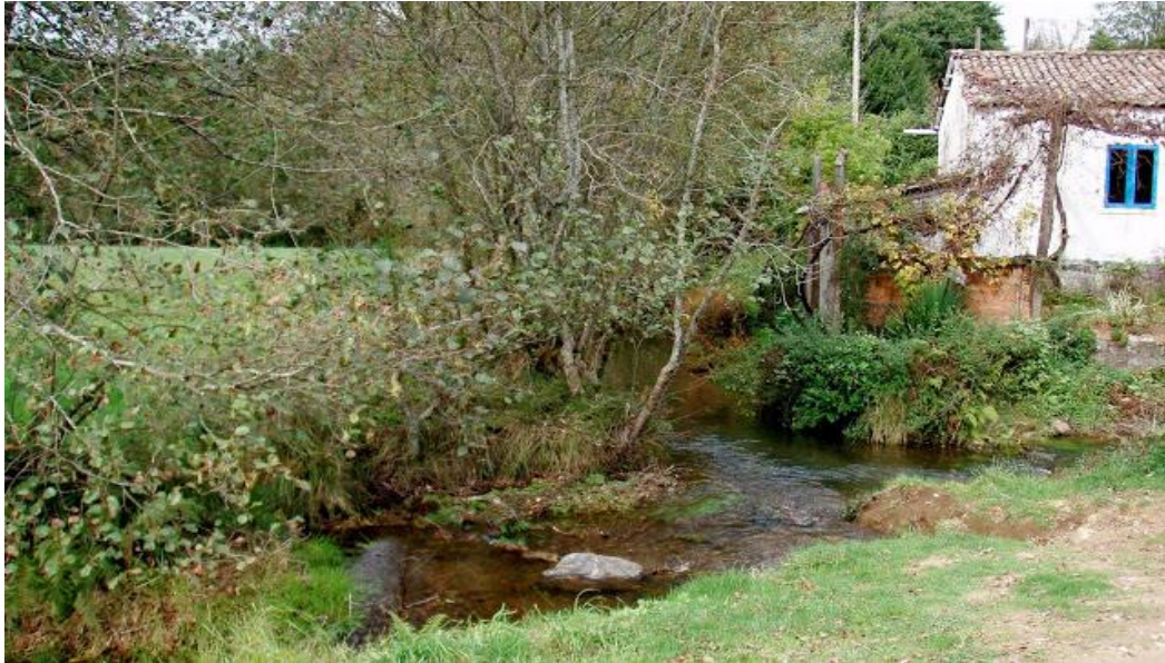
Ilustración 4: Río Lavacolla e casa derruida