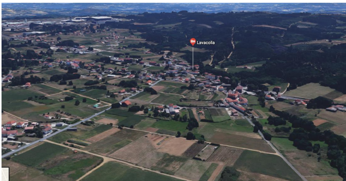
Ilustración 3: Vista aérea das plantacións de Lavacolla

Respecto á estrutura económica do territorio, todas/os as/os entrevistados semellan estar dacordo en que as actividades agrícolas teñen un peso moi baixo na parroquia (Entrevista 1 e 2). Cando chegamos á zona por primeira vez, non obstante, notamos a presenza dunha gran cantidade de pequenas leiras e hortas nos arredores das casas. A maioría dos cultivos eran de forraxe e millo, sobre todo. Máis adiante, atopamos un establecemento dedicado á distribución de insumos agrícolas que nos confirmou que a maioría dos seus clientes non eran locais, senón alleos. Principalmente, as dúas granxas que se dedican formalmente a actividades do sector primario na parroquia, as cales se atopan, unha na aldea de As Quenllas, outra na de Vilamaior (Entrevista 3). Deducimos disto que a produción agrícola que se dá no lugar está dedicada principalmente ao autoconsumo; que se empregan nela modos de cultivo tradicionais e de pequena escala, que non requiren insumos complexos; e que non está orientada ao mercado.