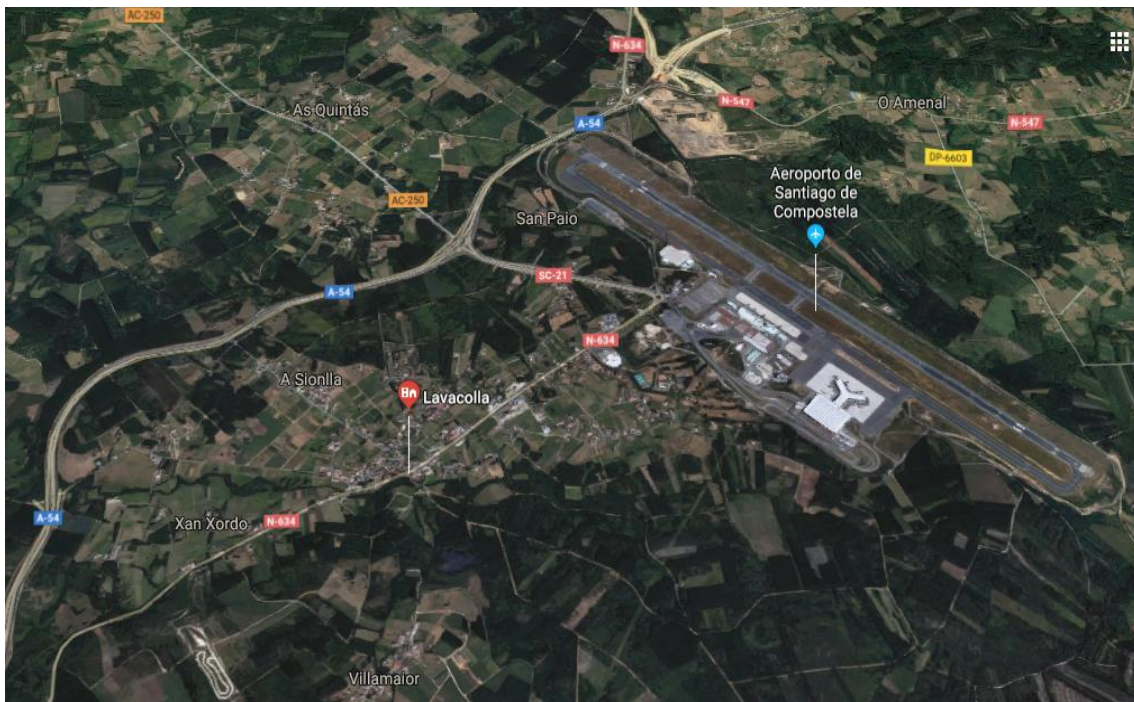
Ilustración 2: Vista aérea de Lavacolla

Non todas as zonas rurais de Galicia contan cun aeroporto ou unha importante etapa do Camiño de Santiago que as atravesese. Resulta obvio mesmo a estas alturas do traballo que estas dúas circunstancias caracterizan fortemente a economía de Lavacolla, e fan dela un lugar moi especial, situado no moitas veces difuso límite entre o rural e o urbano.