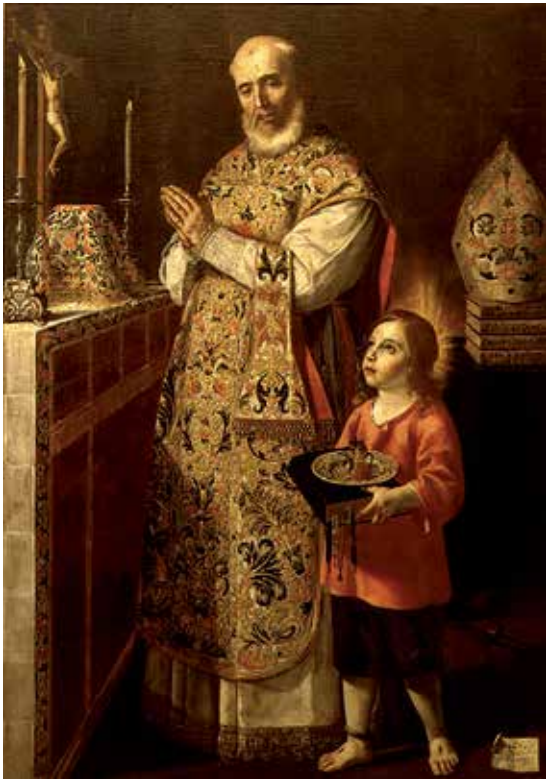
Fig. 4.- ESPINOSA, Jacinto, La misa de San Pascual . Colección Real Academia de San Carlos (depositado en el Museo de Bellas Artes de Valencia).

do precio en que se tasa, parece ser que se trataba de una pintura de “primerísima clase”, que si Espinosa no repitió el tema podría tratarse de la obra que hoy pertenece a la Academia y que su donante, la marquesa de Ráfol 48 pudo haber adquirido a los albaceas de Fita 49 . Estevan