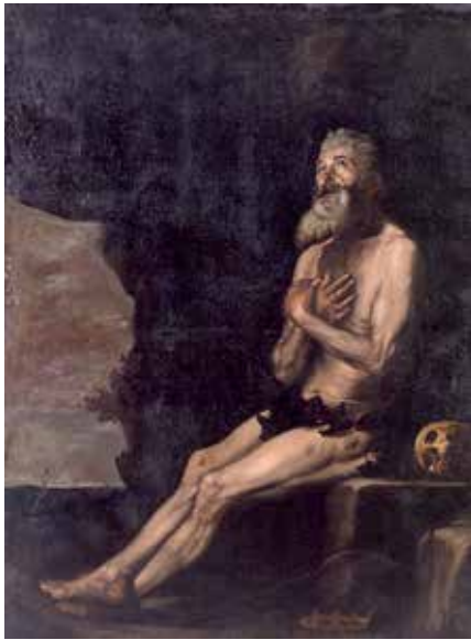
Fig. 2.- MARCH, Miquel, San Onofre . Colección Real Academia de San Carlos (depositado en el Museo de Bellas Artes de Valencia).