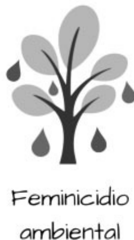
Imaxe 1: Logotipo