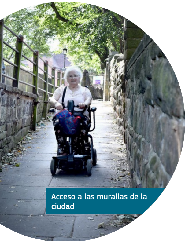
Acceso a las murallas de la ciudad

Chester ha ido mucho más allá de los requisitos mínimos legales en materia de accesibilidad para asegurar que el mayor número de personas posible pueda disfrutar de la ciudad.