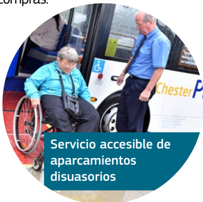
Servicio accesible de aparcamientos disuasorios

Para ayudar a las personas con discapacidad a la hora de ir de compras, el ayuntamiento ofrece un gran número de espacios de estacionamiento designados y gestiona un sistema llamado «Shopmobility» que permite a las personas mayores y con discapacidad contratar una silla de ruedas o una moto para ayudarles a acceder a las áreas de compras. El sistema está disponible siete días a la semana y también proporciona un servicio de acompañamiento y asistencia («Ability Angels»), que acompañan y ayudan a las personas que lo necesitan para ir de compras.