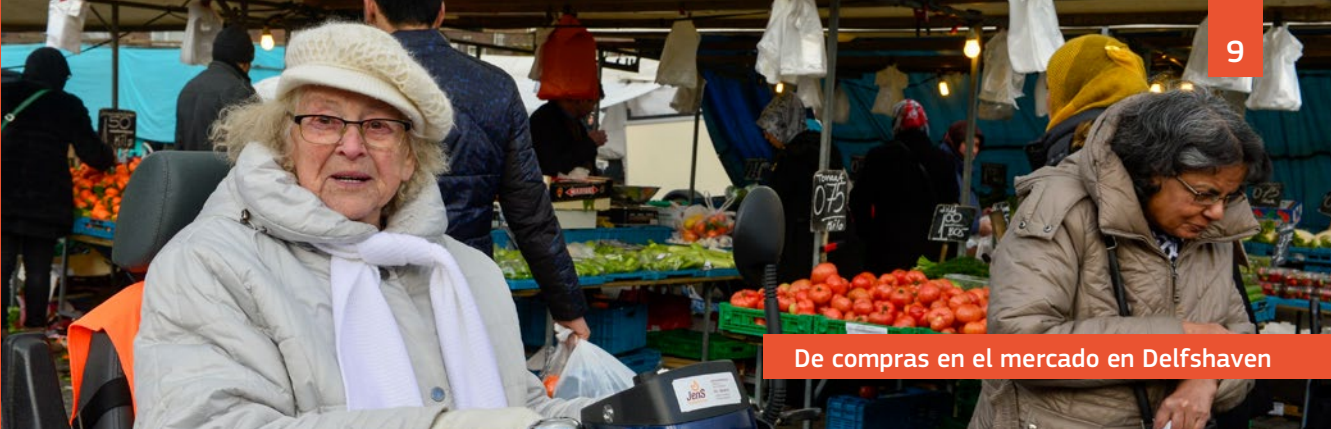
De compras en el mercado en Delfshaven