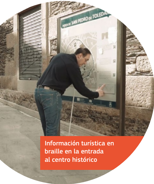
Información turística en braille en la entrada al centro histórico