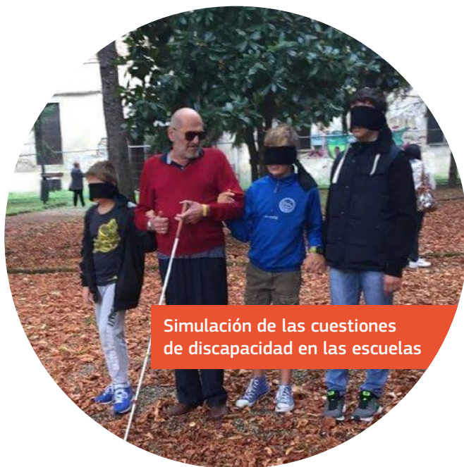
Simulación de las cuestiones de discapacidad en las escuelas