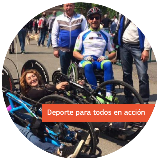
Deporte para todos en acción

Asimismo, se ha previsto un evento para 2017 (Abititando), que incluirá demostraciones de nuevas tecnologías para ayudar a superar la discapacidad, así como talleres y conferencias sobre la entrada en el mundo laboral y la educación para personas con discapacidad.