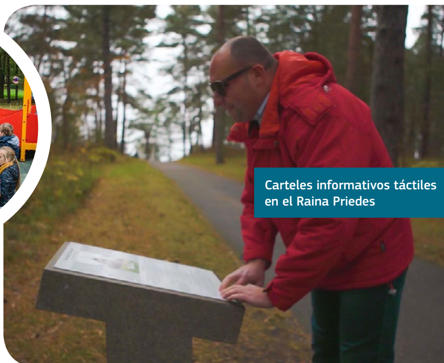
Carteles informativos táctiles en el Raina Priedes

En 2017, la ciudad tiene previsto llevar a cabo una auditoría para determinar el nivel de accesibilidad para todos los ciudadanos de Jūrmala y seguir trabajando con personas con discapacidad y de edad avanzada para satisfacer sus necesidades en todos los aspectos de la vida de la ciudad, así como la apertura de nuevas oportunidades de turismo accesible.