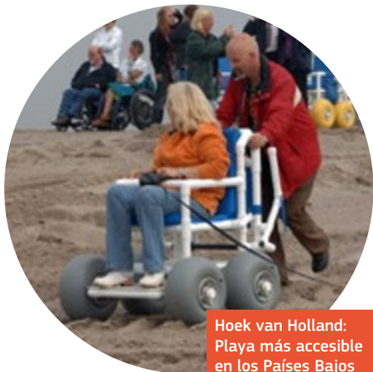
Hoek van Holland: Playa más accesible en los Países Bajos

“ ¡Uso todo el tiempo la aplicación «Better Outdoors»! Es fácil de usar en el teléfono móvil y es cierto que reparan todo muy rápido. ” Nel Jubilado