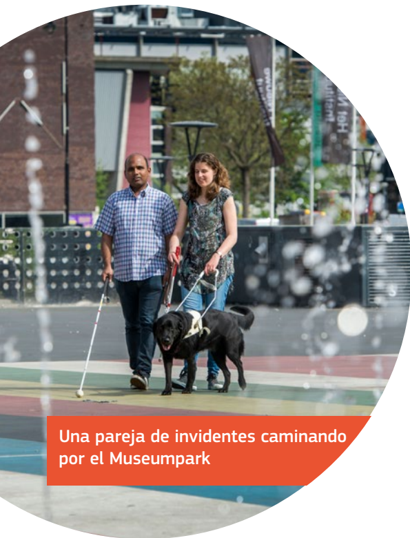
Una pareja de invidentes caminando por el Museumpark

Se puede informar de los problemas de acceso por teléfono, Internet o utilizando una aplicación llamada «Better Outdoors» (mejor al aire libre). A través del programa «repaid repair» (reparación rápida) el ayuntamiento soluciona en un plazo de 24 horas quejas urgentes en materia de acceso.