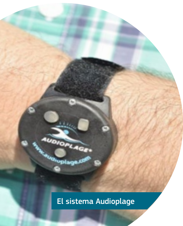
El sistema Audioplage

Se hace mucho hincapié en todo el proceso al implicar a las personas con discapacidad en las zonas afectadas para garantizar que se entienden completamente sus necesidades.