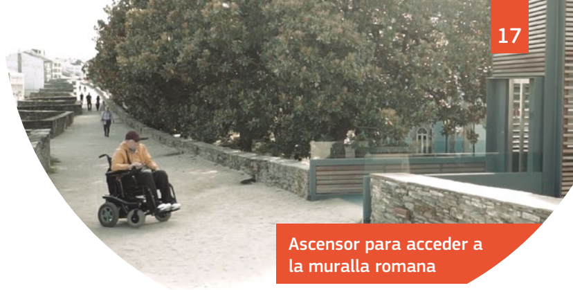
Ascensor para acceder a la muralla romana

personas en el espectro autista en piscinas, instalaciones gubernamentales provinciales y en el Museo Provincial.