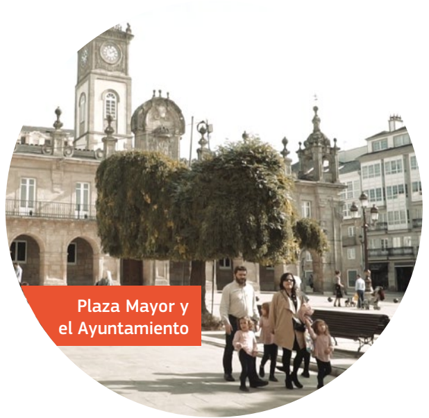
Plaza Mayor y el Ayuntamiento