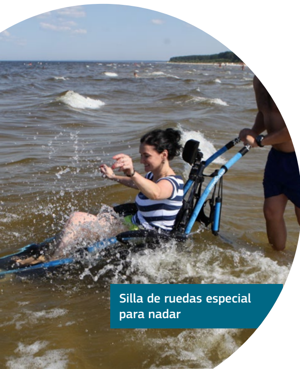
Silla de ruedas especial para nadar

Todos los autobuses también son accesibles y disponen de suelos bajos, rampas, números de autobús y un diseño interior con contraste de color para usuarios de sillas de ruedas y