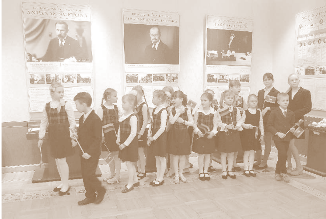
25. Istorinė Prezidentūra Kaune. Atnaujintoje prezidentų ekspozicijoje.