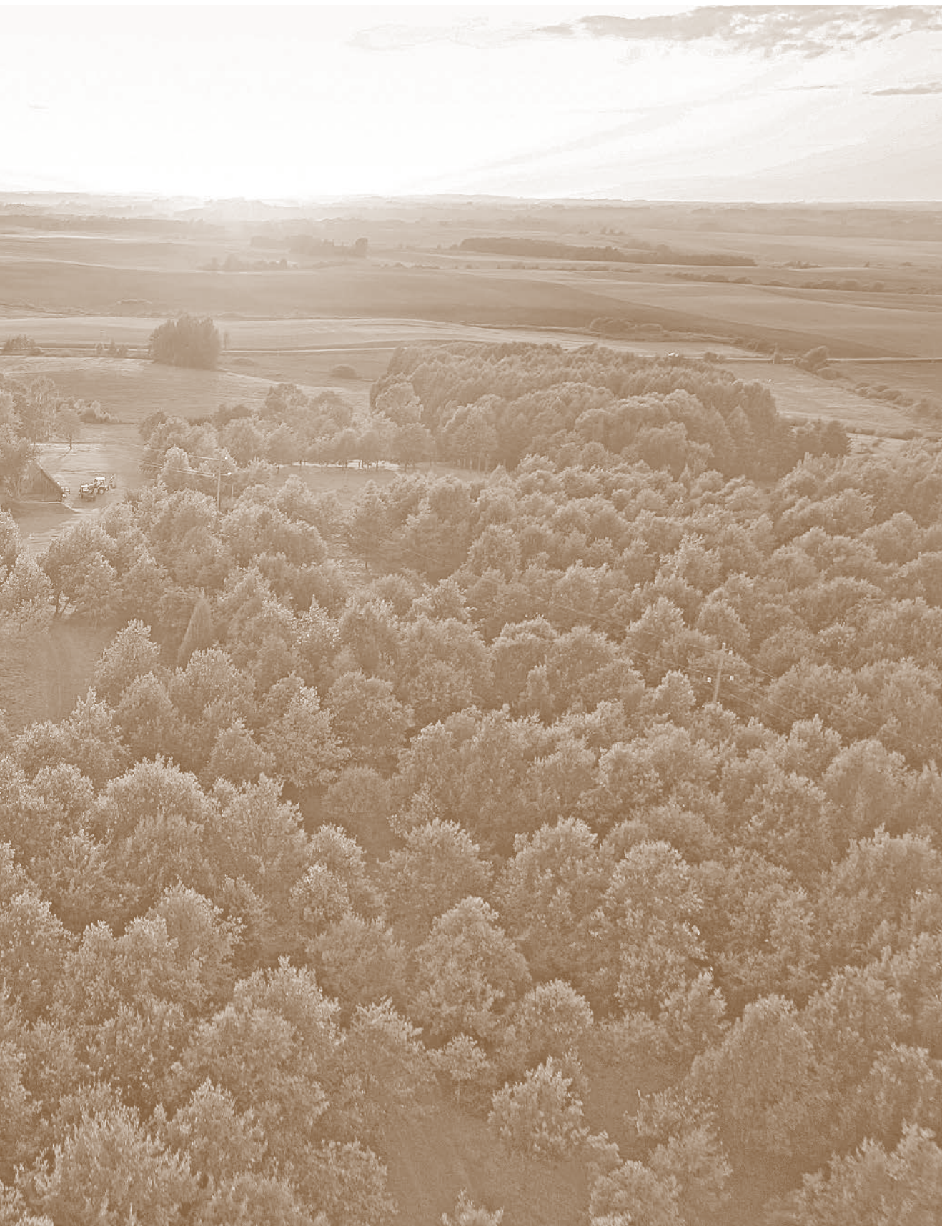
24. Lietuvos atgimimo ąžuolynas ir Jono Basanavičiaus gimtinė iš paukščio skrydžio. 2014 m.