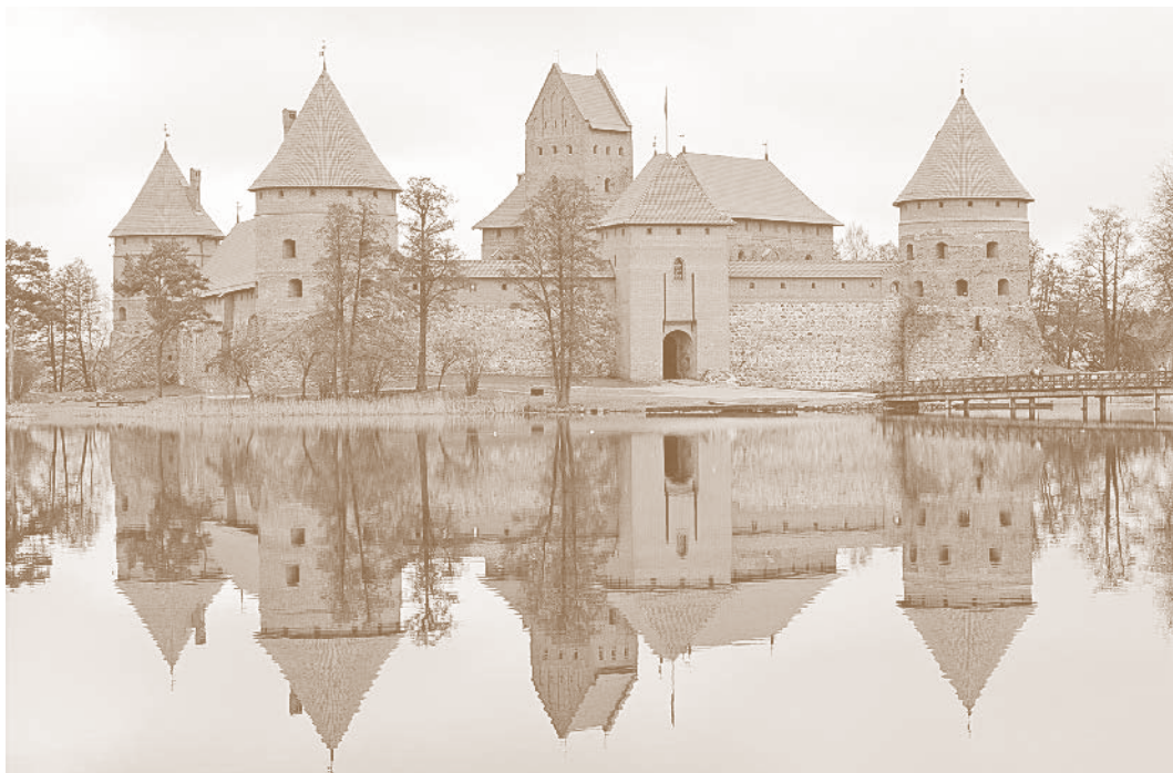
18. Trakų pilis – Trakų istorijos muziejus. 2012 m.