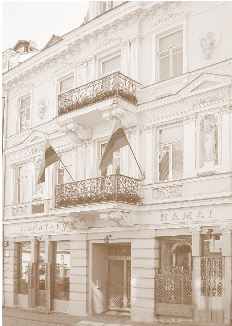
22. Signatarų namų pastatas – istorijos ir architektūros paminklas, kuriame 1918 m. vasario 16 d. buvo pasirašytas Nepriklausomos Lietuvos Valstybės Atkūrimo Aktas. Pastate įrengta ekspozicija pasakoja XX a. pradžios tautinio atgimimo ir modernios Lietuvos valstybės atkūrimo istoriją (1900–1918), yra paminklas Lietuvos Tarybos nariams – Lietuvos Nepriklausomybės Akto signatarams.

2009 m. Meilutės Peikštenienės nuotrauka. Lietuvos nacionalinis muziejus