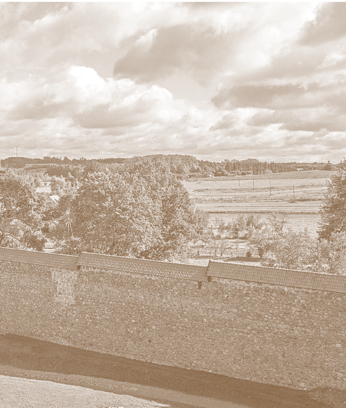
19. Medininkų piliis – Trakų istorijos muziejaus filialas. 2012 m. Trakų istorijos muziejus