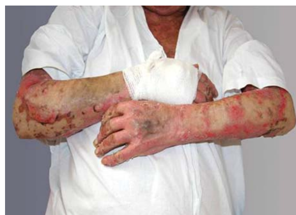
Rycina 2. Stan miejscowy przy przyjęciu do Kliniki – symetrycznie rozmieszczone zlewne ogniska rumieniowo-nadżerkowe

Figure 1. On admission to the department: concentric erythematous and oedematous macules and papules with classic target lesions