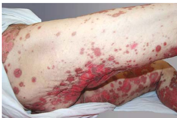
Rycina 1. Stan miejscowy przy przyjęciu do Kliniki – koncentryczne plamy i grudki rumieniowo-obrzękowe przypominające kształtem tarczę strzelniczą

W badaniach immunologicznych surowicy wykazano przeciwciała przeciwjądrowe (ANA) w mianie 640, o typie świecenia homogennym i plamistym, przeciwciała ds-DNA w mianie 160 oraz przeciwcia-