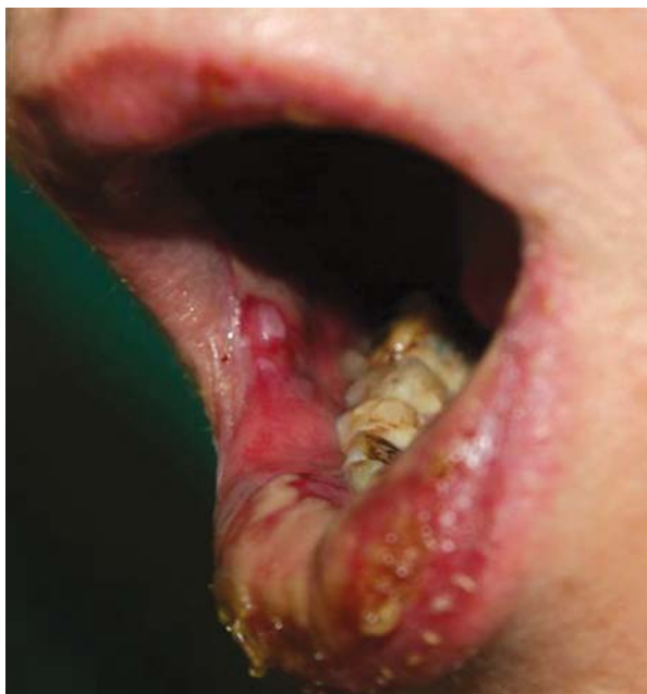
Rycina 3. Niegojące się nadżerki błon śluzowych jamy ustnej, pokryte surowiczo-ropną wydzieliną

Figure 3. Erosions on buccal mucosa with serous and purulent exudate