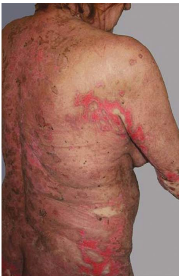
Rycina 4. Stan poprawy (trzecia doba terapii IVIG) widoczne cechy epitelizacji

Figure 3. Erosions on buccal mucosa with serous and purulent exudate