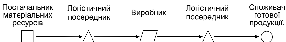
Рис. 4.2. Структурно-логічна схема логістичного каналу

Основними складовими макрологістичної системи є логістичні канали (називають також канали розподілу, канали товароруху, канали збуту), які складають відокремлену сукупність ланок логістичної системи (підприємств), орієнтованих за матеріальним потоком, що об'єднані з метою виконання маркетингових вимог та/або економії на масштабах логістичної діяльності за рахунок гармонізації трансакційних одиниць упаковки, зберігання, вантажопереробки і транспортування продукції [15] (рис. 4.2).