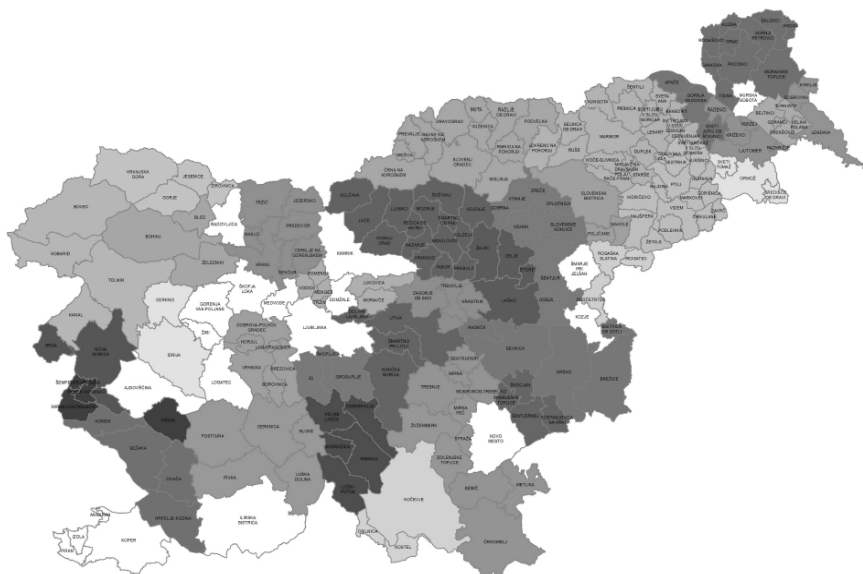
Slika 2: Vključenost občin v organe skupnih občinskih uprav – področje inšpekcij

Na lokalni ravni je inšpekcija organizirana v okviru občinske uprave. Dve ali več občin skupaj lahko ustanovijo medobčinski inšpektorat, ki je pogosto povezan tudi z medobčinskim redarstvom in pokriva območja vključenih občin (sliki 2 in 3). Empirični podatki kažejo, da je ustanavljanje medobčinskih inšpektoratov in redarstev ena od najpogostejših oblik medobčinskega sodelovanja na področju izvajanja upravnih nalog (Rakar, Tičar in Klun, 2015). Medobčinsko sodelovanje zagotovi strokovno usposobljenost in specializacijo kadrov za raznovrstne naloge, ki jih inšpekcija opravlja, na drugi strani pa omogoči racionalnejše organizirano delo, sama organizacija dela pa je tudi cenejša (Železnik, 1999). Razlogov za tako pogosto medobčinsko sodelovanje na tem področju je več (Rakar in Grmek, 2011), izpostavili pa bi sofinanciranje stroškov teh organov s strani države v obsegu 50 % in neposredne finančne učinke delovanja teh organov (globe kot vir financiranja občin).