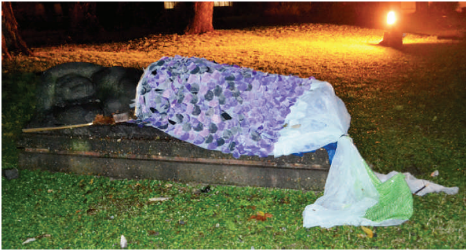
FIGURAS 4 y 5