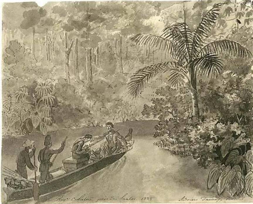
4. Rio Cubatão, perto de Santos, Taunay, 1825.

A palmeira no canto direito, além da finalidade de retratar a espécie, ajuda a caracterizar o ambiente tropical com uma planta que se tornou símbolo dos trópicos americanos, mesmo sendo muitas espécies de palmeiras de origem asiática. Percebe-se que Taunay não quis fazer somente o registro da passagem dos membros da expedição pelo rio paulista, mas também procurou oferecer ao espectador a sensação de mata fechada, úmida e abafada própria dessas florestas. O preenchimento em manchas da parte superior da imagem como massas de vegetação ajuda a recriar essa sensação, através de pinceladas que só um artista “com total espírito poético” seria capaz de captar.