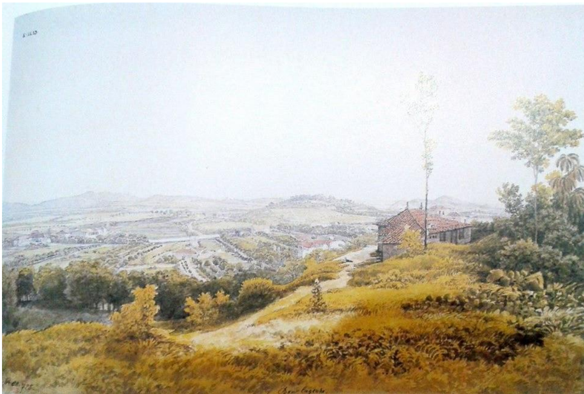
2. Bom Engenho , Thomas Ender.

Academia de Belas Artes de Viena e que foram publicadas no livro organizado por Júlio Bandeira e Robert Wagner (2000) registram paisagens que mostram bem a ocupação da cidade. Uma em especial vale ser analisada nesse contexto. Intitulada “Bom Engenho”, a seguinte aquarela sobre lápis nos mostra um panorama do atual bairro do Engenho Novo, localizado na zona norte do Rio, nos inícios dos oitocentos (Figura 2).