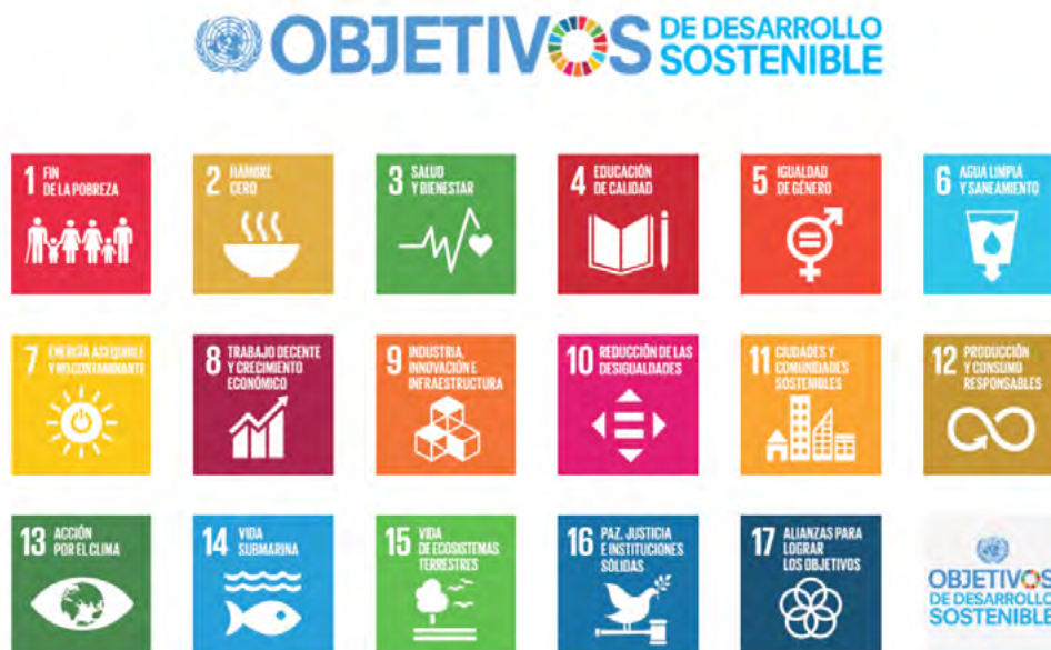
Figura 3: Objetivos de Desarrollo Sostenible propuestos por la Organización de las Naciones Unidas.

En este sentido, la problemática propuesta y su trabajo en el aula atiende a uno de los Objetivos de Desarrollo Sostenible (ODS) propuestos por la Organización de Naciones Unidas en su Agenda 2030 (Naciones Unidas, 2018) (figura 3).