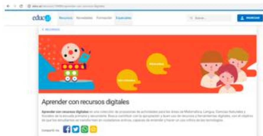
Figura 3. Captura de pantalla Portal Aprender Conectados, sección Recursos.