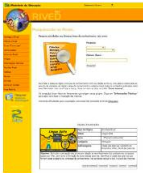
Figura 2. Captura de pantalla página de inicio RIVED.

Los objetos de aprendizaje producidos por RIVED son actividades multimedia interactivas en forma de animaciones y simulaciones lo que representa una relevante característica pedagógica y tecnológica pues sus objetivos han sido propuestos para probar las diferentes formas, para seguir la evolución temporal de las relaciones, causa y efecto, para visualizar conceptos desde diferentes puntos de vista, para probar hipótesis, siendo estas herramientas o instrumentos relevantes para innovar, relacionar conceptos y despertar curiosidad en la resolución de problemas. También de acuerdo con el propio portal de difusión, estas actividades interactivas ofrecen oportunidades para explorar fenómenos científicos y conceptos que a menudo son inviables o inexistentes en las escuelas debido a problemas económicos y de seguridad, como: experimentos de laboratorio con sustancias químicas o de genética, velocidad, grandeza, medidas, fuerza, entre otros. Eso le ha exigido un diseño web con las características de interactividad, sobre todo.